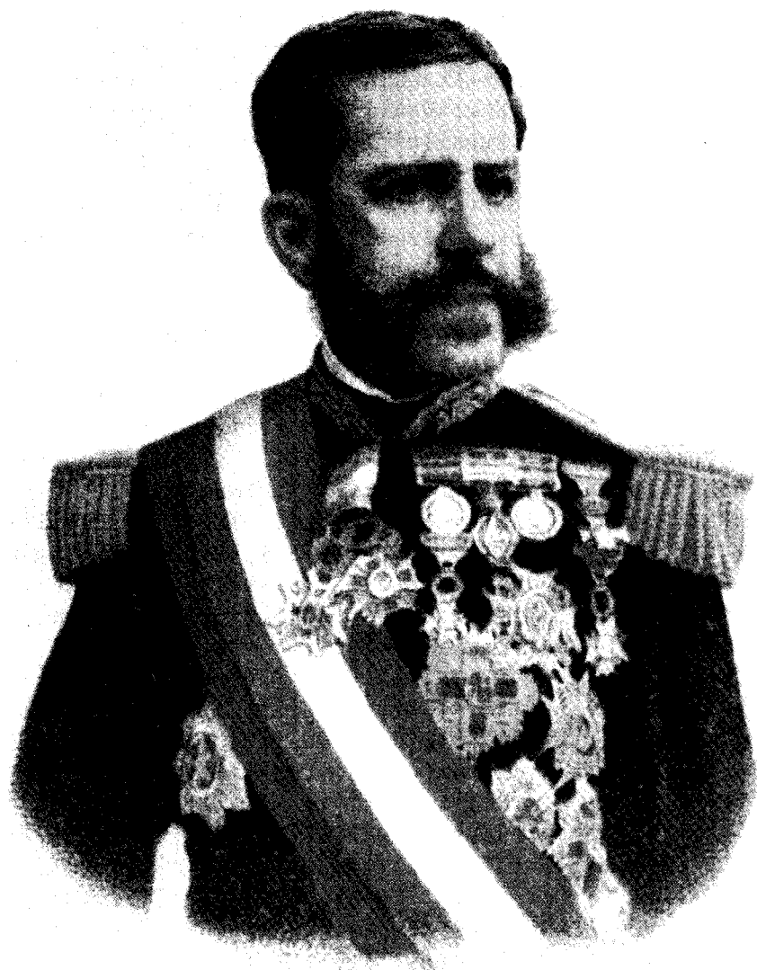
Capitán General Valeriano Weyler.