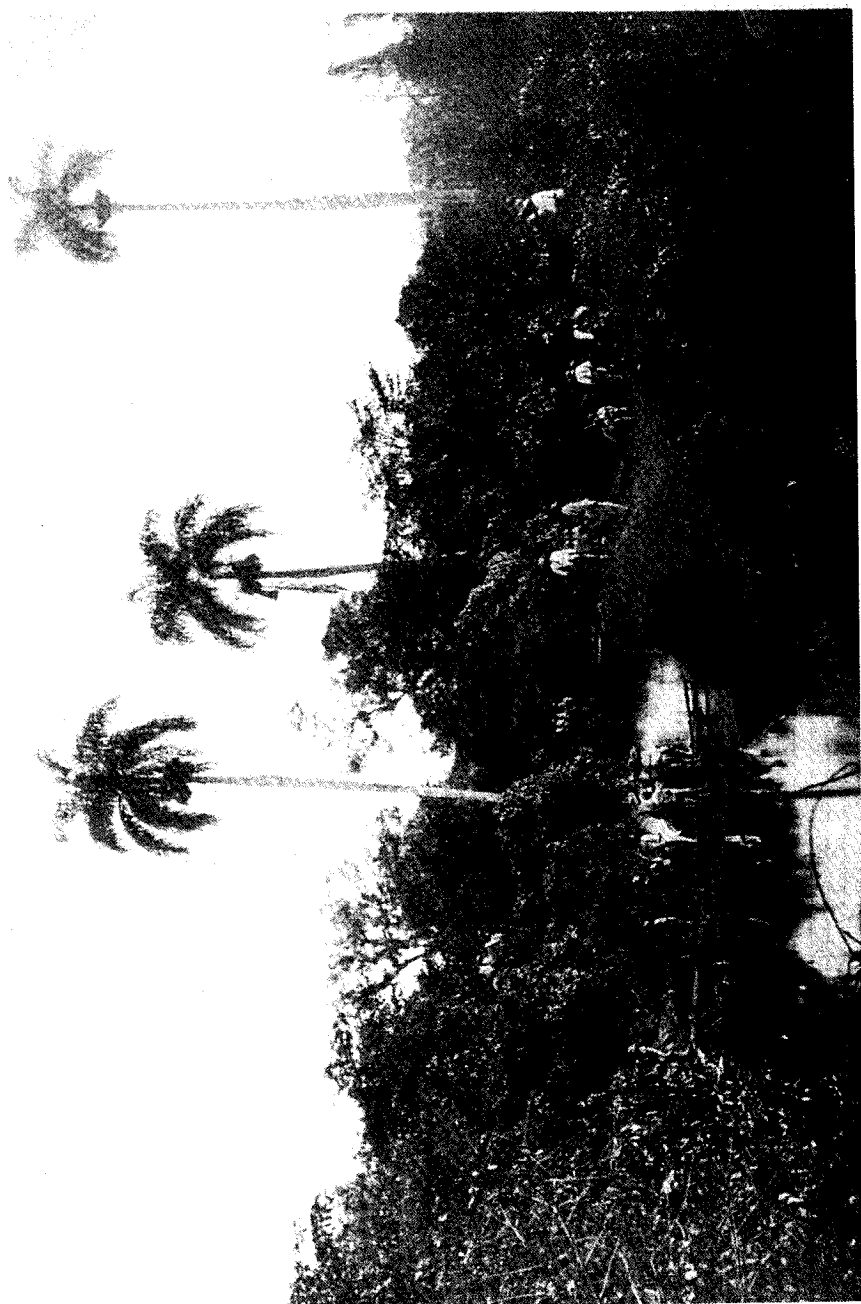
Grupo de insurrectos en La Manigua.