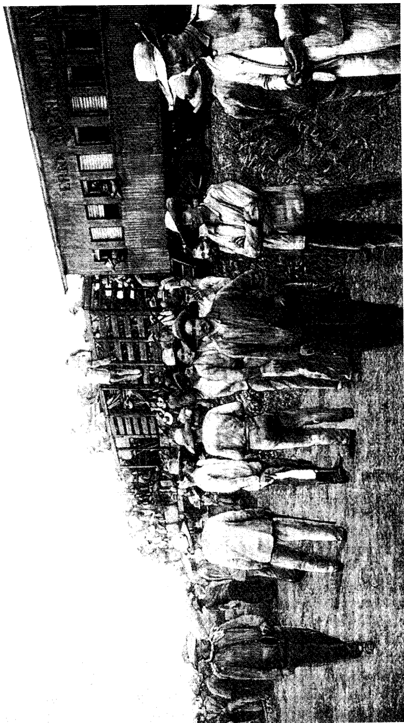
La guerra en Cuba. Un tren militar conduciendo tropas.