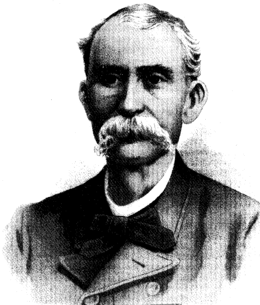
General Máximo Gómez.