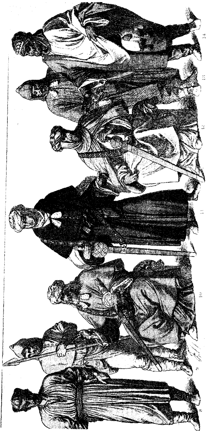
Trajes de los moros españoles: 8. Moro llevando gorra en lugar de turbante y túnica larga. 9. Moro español en traje de caza llevando polainas. 10. Moro llevando pénula o capote romano con mangas. 11. Moro llevando esclavina con capucha. 12. Moro llevando turbante que deja caer los extremos del chal sobre los hombros. 13. Moro con túnica y capucha de la misma tela. 14. Moro llevando la pénula o capote romano.