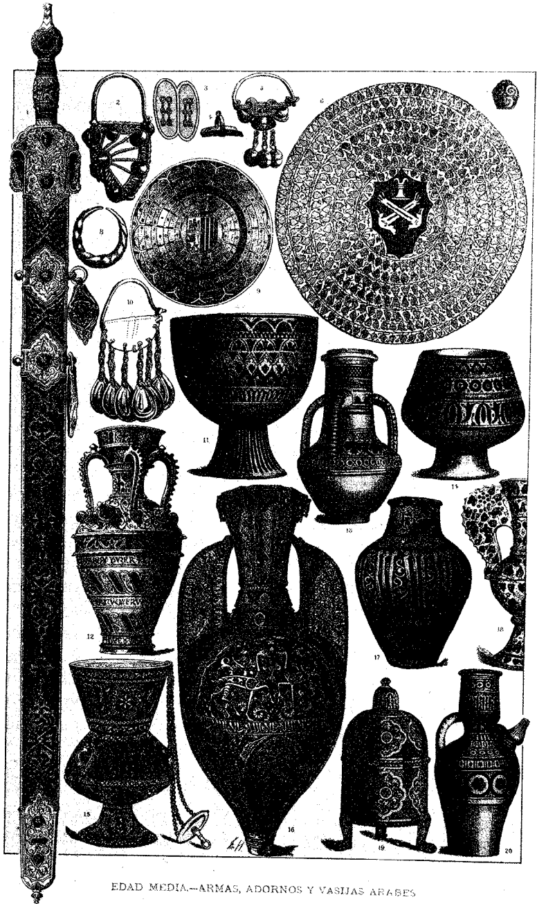
EDAD MEDIA.—ARMAS, ADORNOS Y VASIJAS ÁRABES

Edad Media. Armas, adornos y vasijas árabes.