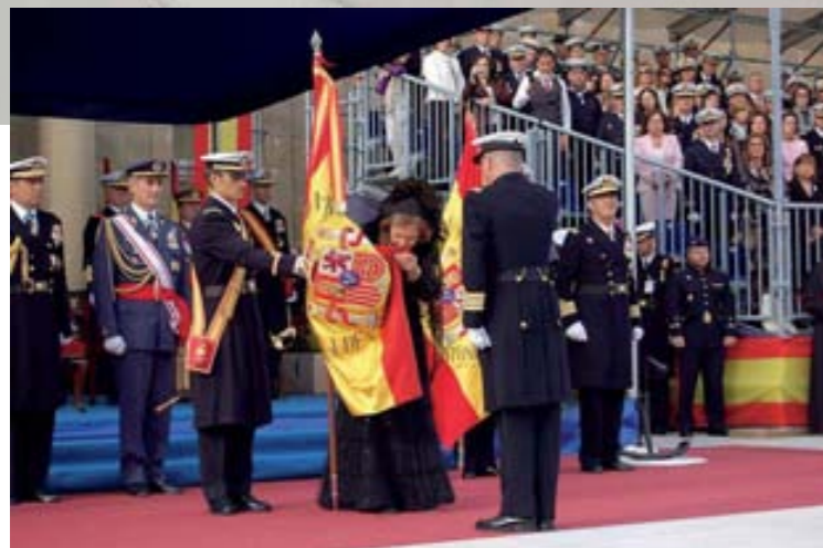
S.M. la Reina presidió y actuó como madrina de la entrega de las banderas a las Escuelas de Especialidades de la Armada «Antonio de Escaño» y ESENGRA, donadas por el Ayuntamiento de Ferrol.

S.M. la Reina presidió el pasado 15 de octubre la entrega de sendas banderas de combate, donadas por el Ayuntamiento de Ferrol, a las dos escuelas de especialidades que posee la Armada en esta localidad coruñesa, la «Antonio de Escaño» y la ESENGRA, donde se preparan cada curso más de 1.800 alumnos para las especialidades fundamentales de Marinería.