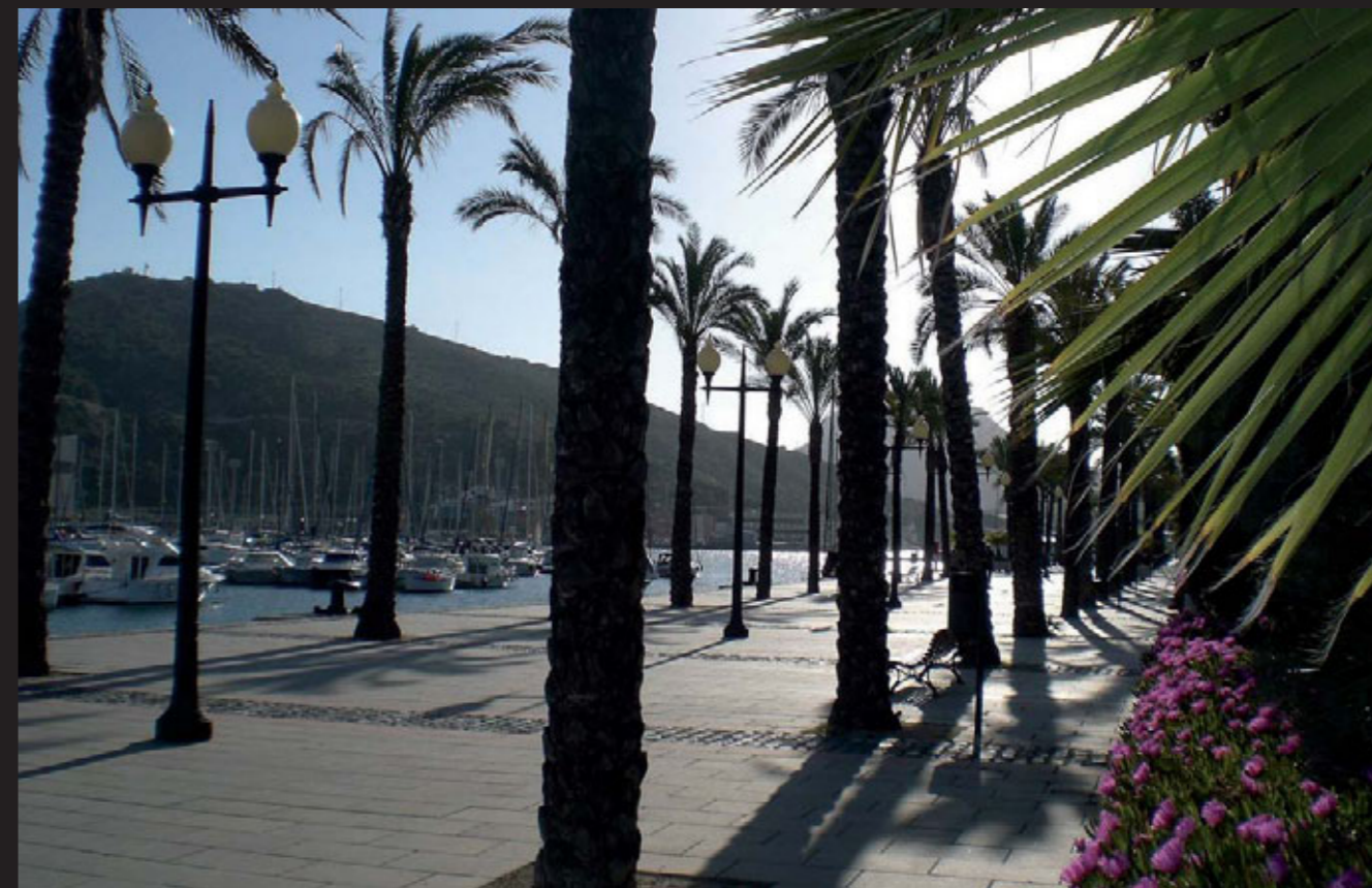
Atardecer en el puerto.

Tu limpia trayectoria de servicio a la Armada merece ser conocida para ejemplo y estímulo de los que ahora llevan tu testigo. Estos servicios son, igualmente servicios a España, a la Patria que supo seguir por el azul del mar el caminar del sol.