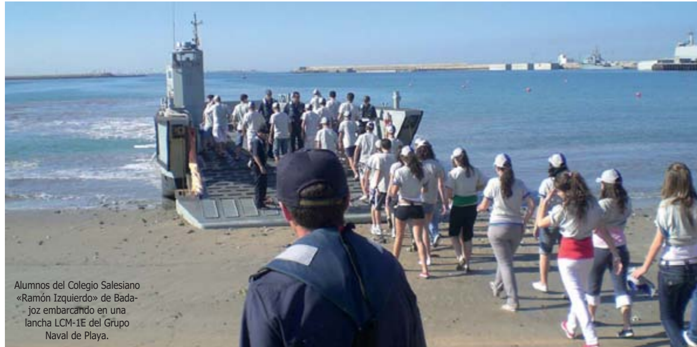
Alumnos del Colegio Salesiano «Ramón Izquierdo» de Badajoz embarcando en una lancha LCM-1E del Grupo Naval de Playa.

Día 19: Nuestros invitados se levantaron a 08:00 h., a toque de diana, para estar listos para el desayuno a 09:15 h. A continuación se procedió al embarque en la Playa del Salado de los alumnos en una Lancha LCM-1E del Grupo Naval de Playa, para efectuar una navegación por la Bahía de Cádiz y posterior desembarco en la Estación Naval de Puntales. Este evento despertó gran interés por ser el Bautismo de Mar para la gran mayoría de los asistentes.