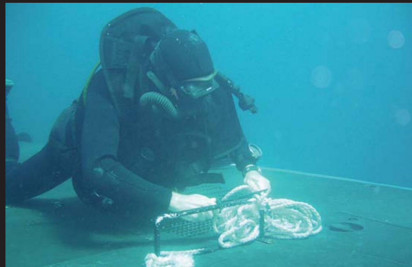
La Unidad Especial de Buceadores de Combate en actividad.