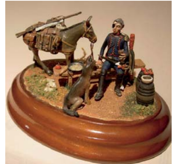
Camino del Báltico (Hamburgo 1806).

El diorama representa el momento de descanso de un subteniente de la compañía de artillería, que es aprovechado para comer una sabrosa paella en compañía de su perro y su burro de carga, antes de reiniciar el camino hacia las costas del mar Báltico.