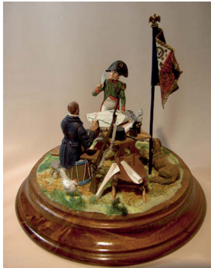
Napoleón decidiendo el ataque a Burgos (Victoria 1808).

El diorama representa a Napoleón con uniforme de cazador de la guardia, decidiendo el ataque sobre la ciudad de Burgos a causa de las malas noticias que ha recibido de los mensajeros de los mariscales Lefebvre y Víctor. El primero, se había replegado con sus tropas sobre Bilbao y el segundo no había acudido en su ayuda.