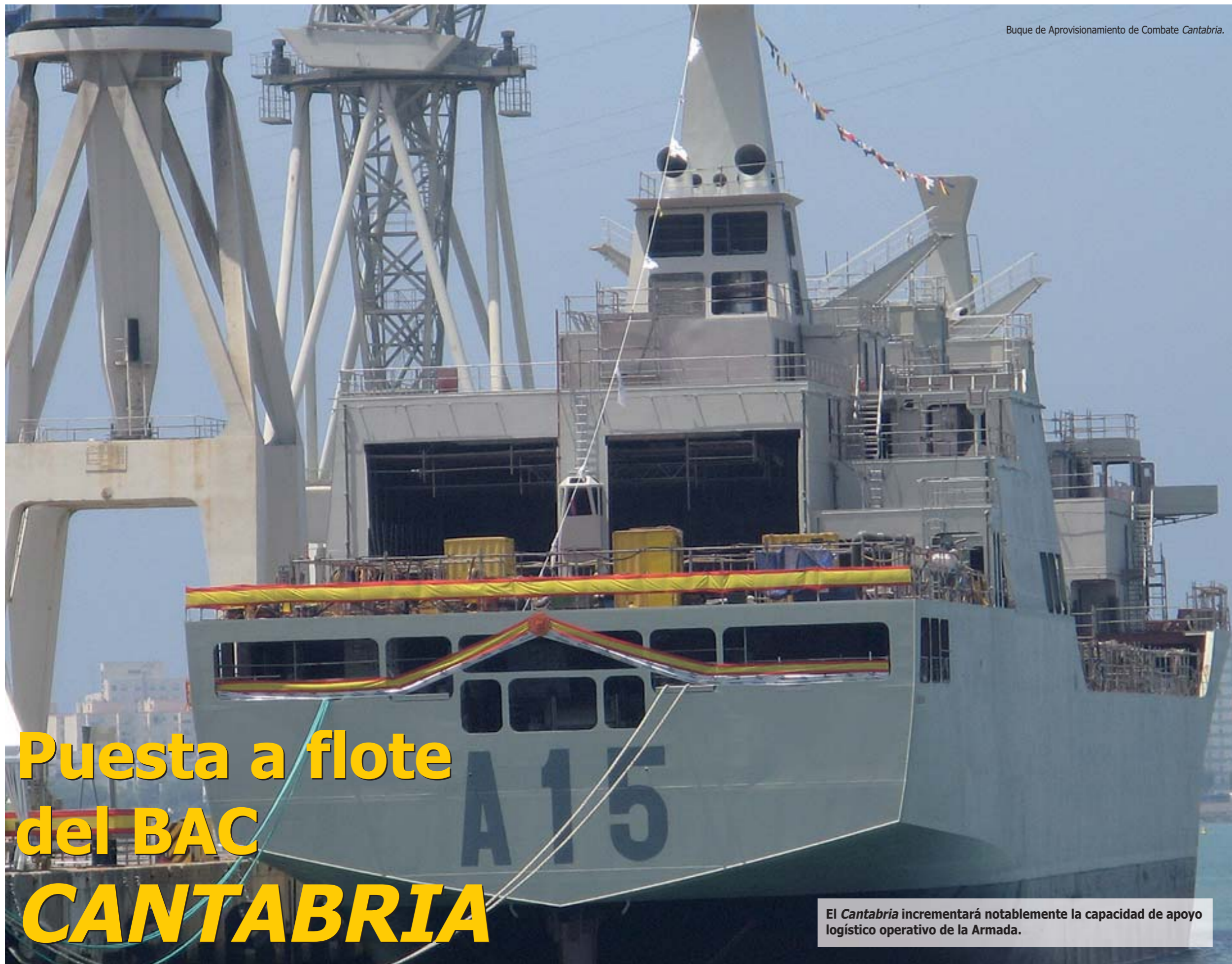
Buque de Aprovisionamiento de Combate Cantabria .