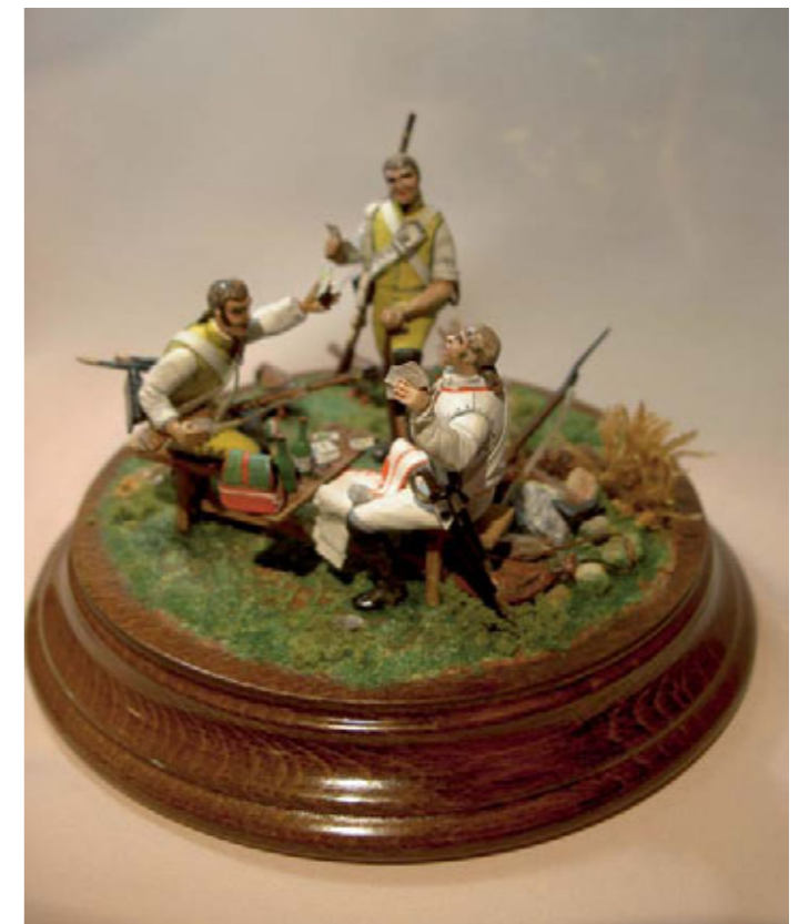
Acalorada partida de cartas al «tute cabrón» (Odense 1808).

Este otro diorama representa a los soldados de los regimientos de Guadalajara y Almansa que juegan alegremente una partida de cartas en la campiña danesa, ajenos a las noticias de los acontecimientos que estaban ocurriendo en España.