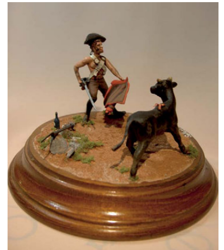
¡Suerte y al toro que más cornadas da el gabacho! (Isla de León 1809).