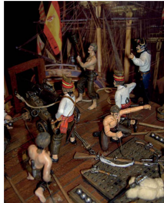
A bordo del navío Santísima Trinidad (Trafalgar 1805).

El diorama representa un cañón naval de 18 libras situado a estribor de la cubierta del castillo del navío Santísima Trinidad (122 cañones) en el momento de hacer fuego, asistido por una dotación de seis artilleros y un jefe de pieza.