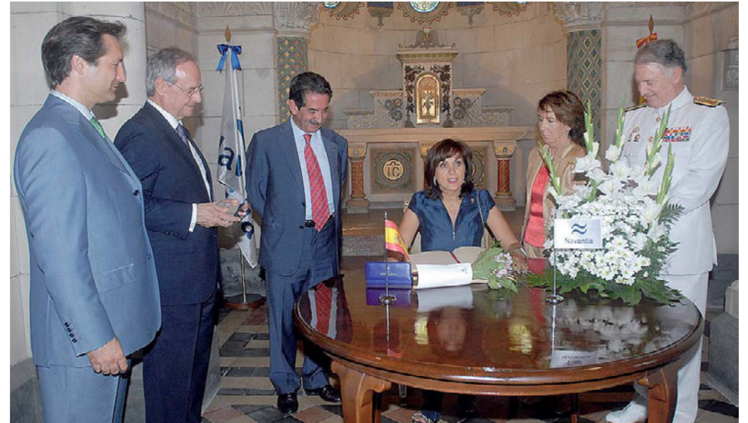
Firma en el Libro de Honor.

A través de sus cinco estaciones de aprovisionamiento (dos en cada costado y una en popa) puede suministrar 8.000 metros cúbicos de combustible para buques y 1.500 metros cúbicos de combustible para aeronaves; así como munición (515 m 3 en dos bodegas), pertrechos y víveres (83 m 2 para respetos y sonoboyas, un