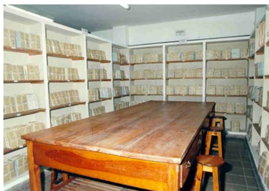
Depósito y área de trabajo

En la actualidad el Archivo consta de tres Secciones: Personal, Causas y Material y Asuntos. La primera Sección ubicada en la