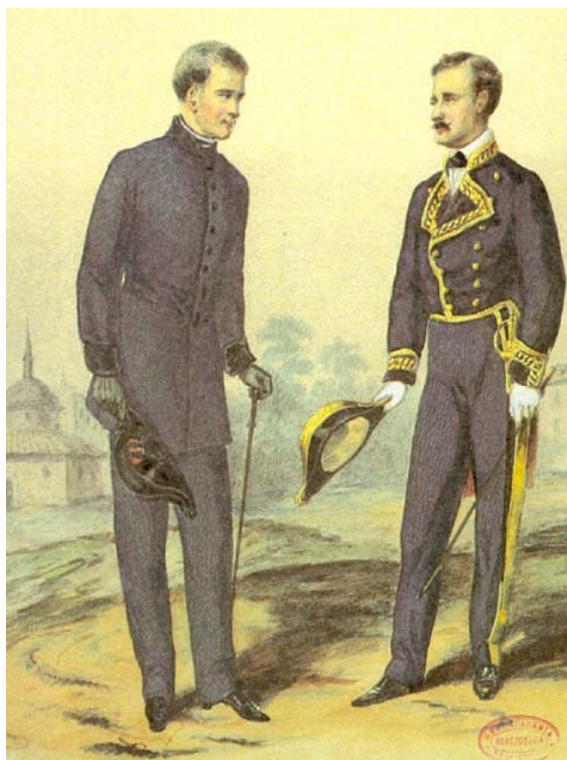
Cuerpo Eclesiástico y Jurídico. Reinado de Isabel II.

La última etapa arranca de la Constitución de 1978 y de los preceptos que establece: el carácter laico del Estado y la libertad religiosa, al tiempo que asume la cooperación con la Iglesia Católica y demás confesiones; así el Estado Español y la Santa Sede llegan al Acuerdo sobre la asistencia religiosa a los miembros de las Fuerzas Armadas en 1979.