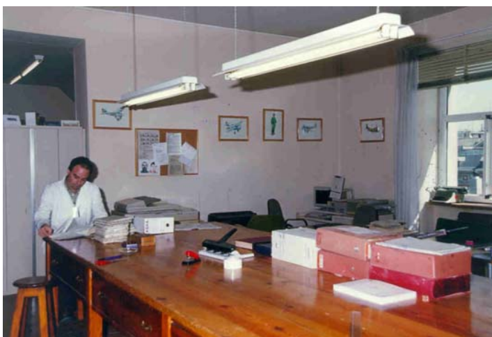
Sala de Trabajo

El Archivo pasó a depender de la Secretaría General, que dispuso su organización interior con arreglo al citado Reglamento. Destinó el personal necesario para cubrir los cometidos del Archivo en esta primera etapa y aumentó el personal auxiliar en cuatro ayudantes, cuatro escribientes y cuatro ordenanzas procedentes de tropa.