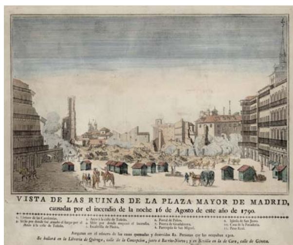
Vista de las ruinas de la Plaza Mayor de Madrid causadas por el incendio del 16-VIII-1790.

La asistencia al congreso, muy especializado, fue numerosa, contabilizándose 300 congresistas de muy variados países. A los organizadores les cupo la satisfacción de comprobar la nutrida asistencia de especialistas de países iberoamericanos, entre los que podemos citar a Cuba, Méjico, Colombia y Argentina, que no habían estado en