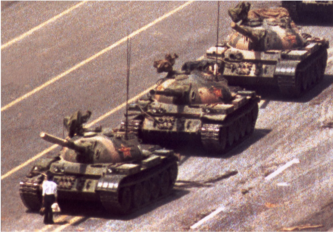
A man tries to halt a column of tanks that is advancing towards Tiananmen Square on the morning of the 4 June 1989.

On the morning of the 4 June, the largest violation of Chinese human rights was committed when tanks fired at unarmed civilians. The Tiananmen massacre, which remains uninvestigated, marked a before and an after in the relations between the only party and the population that “has been present in the evolution of China” 6 and became a huge taboo from the side of the national police force that increasingly needed the catharsis it would have got from a real investigation of the events.