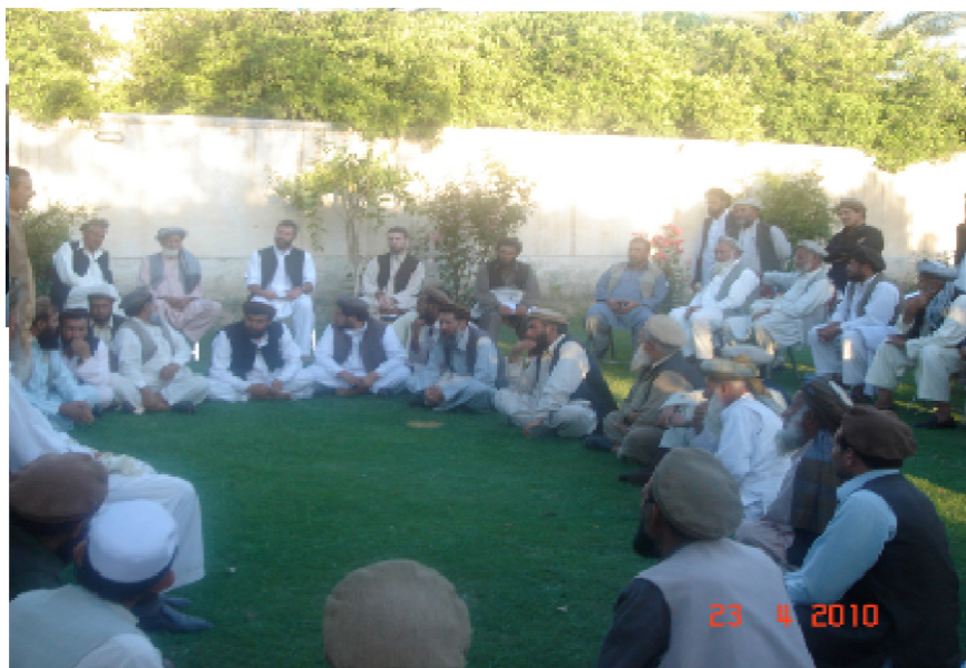
This photo is taken from a traditional Jirga. Esta foto está tomada de una Jirga tradicional.

Algunos afganos dicen que esto es bastante duro con la mujer. Otros dicen que no, que la tratarán bien porque sus parientes masculinos mantendrá un ojo sobre el estado de las cosas. Esta supervisión ayuda a las relaciones de cimentación entre las familias. Probablemente varía mucho según cada caso. Es importante señalar que el restablecimiento del equilibrio entre las familias es visto como más importante que castigar una afrenta individual . Bien podría ser la hermana del malhechor la que sea transferida a la familia de la víctima.