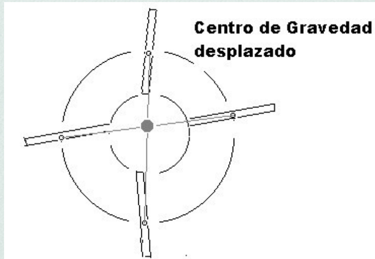
Resonancia en tierra

quedó listo para su ensayo sobre el C-7 el primer rotor articulado en batimiento y en arrastre de la historia. Pero cuando intentaron despegar algo ocurrió: una tremenda trepidación se apoderó del autogiro que a punto estuvo de desintegrarse. Desde luego, esto del ala rotatoria no es nada fácil, había ocurrido la primera entrada en resonancia de un rotor, algo que muchos años después se ha llegado a controlar, aunque de vez en cuando siguen ocurriendo accidentes por esta causa.