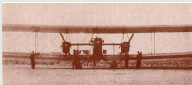
C3, 1919, el mayor avión del mundo de la época, en Cuatro Vientos, Madrid

El avión voló por primera vez el día 8 de junio de 1919 en Cuatro Vientos, y lo hizo muy bien. Tanto es así que en el segundo vuelo el capitán Ríos se atrevió a hacer virajes cerrados con mucha inclinación y cerca del suelo. Estos virajes requieren más fuerza de sustentación que el vuelo normal, mucha más cuanto más abrupto sea el viraje. Y al final el viraje terminó en una pérdida intempestiva.