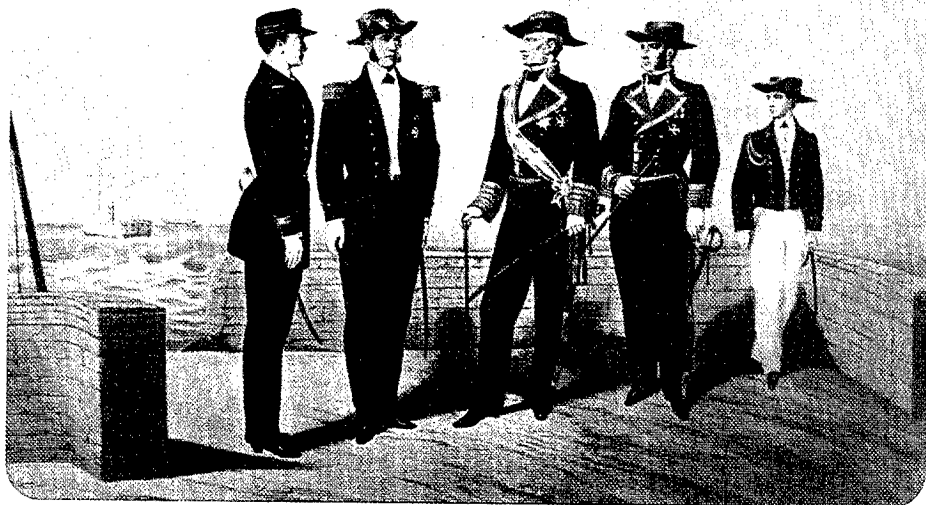
Cuerpo general de la Armada, año 1862: alférez de navío, teniente de navío, capitán general, capitán de navío y guardia marina, con uniforme de gala de verano (Museo Naval).