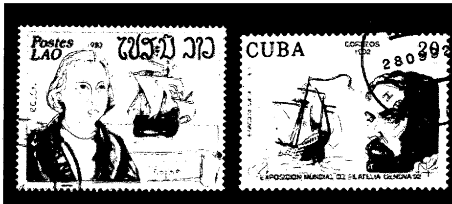
Cristóbal Colón y Alonso de Ojeda, jefes de expediciones de Juan de la Cosa.

gran valor artístico, hoy podemos admirar excelentes ejemplares en los museos, en libros y revistas especializadas, y de vez en cuando en sellos de correos, como es el caso de las emisiones españolas de 1974 ( Atlas Catalán , de los Cresques), 1980 ( Portulano del Mediterráneo de Mateo Prunes), 1981 ( Islas Baleares , de Diego Homen, e Islas Canarias , de Mateo Prunes), por citar algunos ejemplos. Pero en esta ocasión hay que destacar la Carta Universal realizada por el marino, cartógrafo, explorador y conquistador Juan de la Cosa, fechada en El Puerto de Santa María allá por el año 1500 y de la que en el presente año se celebra su Quinto centenario.