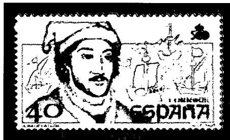
Juan de la Cosa.

De muchas de aquellas cartas, que destacaban por su exactitud geográfica y por su