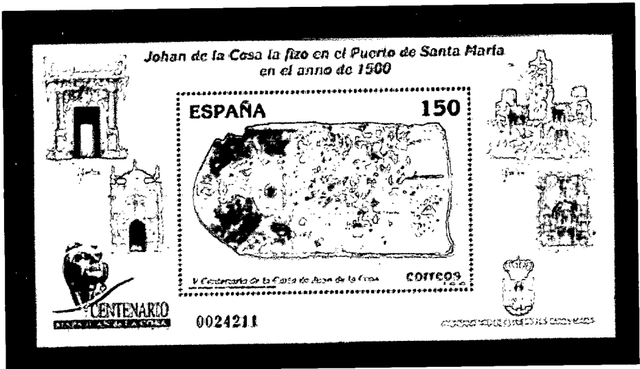
Carta de Juan de la Cosa; emisión de 14 de julio de 2000.

Pedro Marthyr de Anghiera, la carta se encontraba en el despacho de Rodríguez de Fonseca, arcediano que con el tiempo llegaría a ser obispo de Burgos. Posteriormente pasó a estar depositada en la Casa de Contratación de Sevilla, de donde desapareció en fecha indeterminada —posiblemente fue robada durante la guerra de la independencia— y se perdió totalmente su pista. Pasado el tiempo, las primeras noticias que se volvieron a tener