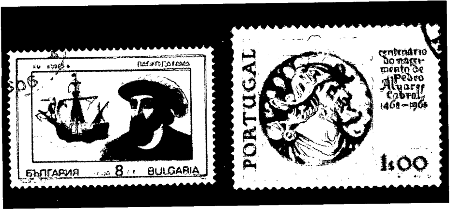
Vasco de Gama y Cabral, exploradores contemporáneos de Juan de la Cosa.

tóbal Colón— con la inscripción «Juan de la Cosa la hizo en el Puerto de S. M a . en el anno de 1500».