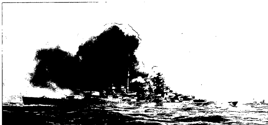
Acorazado Bismarck .

Una vez hundido el Hood , el Bismarck cayó a estribor y concentró su fuego sobre el Prince of Wales , que ahora se encontraba en clara desventaja. El acorazado británico había tenido que maniobrar para evitar colisionar con los restos del Hood , lo que le acercó más a los alemanes. A las 0602, el Bismarck alcanzó al Prince of Wales en el puente, matando a todos los presentes menos al comandante, capitán de navío John Catterall Leach, y a otro hombre. El alcance había caído hasta los 14.000 metros, cuando a las 0603, el Prince of Wales lanzó una cortina de humo y se retiró del combate después de encajar tres impactos más del Bismarck y otros tres del Prinz Eugen . El Prince of Wales disparó tres salvas más con la torre «Y» cuádruple de popa mientras se retiraba. Pero tirando bajo fuego local, ya que el director de tiro no tenía visibilidad debido a la cortina de humo, no logró impacto alguno. A las 0609, cuando la distancia entre ambos contendientes alcanzó los 22.000 metros, los alemanes cesaron de disparar y terminó la batalla. Para los británicos debió de resultar increíble: los alemanes mantenían el rumbo en lugar de perseguir al averiado Prince of Wales (3).