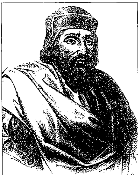
Pedro Navarro, conde de Oliveto, célebre marino y militar español del Renacimiento, inventor de las minas de pólvora terrestres.

Como todas las figuras grandes, don Pedro Navarro fue también uno de los personajes más controvertidos y discutidos en la abundante historiografía que trató su figura, y que convirtió su vida y hazañas en origen de grandes disputas. Desde ser considerado un aventurero vulgar y traidor hasta ensalzarlo como uno de los militares de más mérito y de más justo renombre de nuestra historia castrense, cuya aportación al arte de la guerra fue decisiva en los albores de la Edad Moderna.