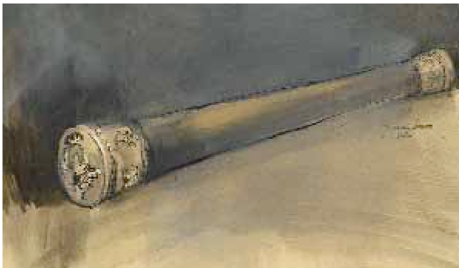
Apunte de la bengala, por gentileza de su autora, María Luaces.