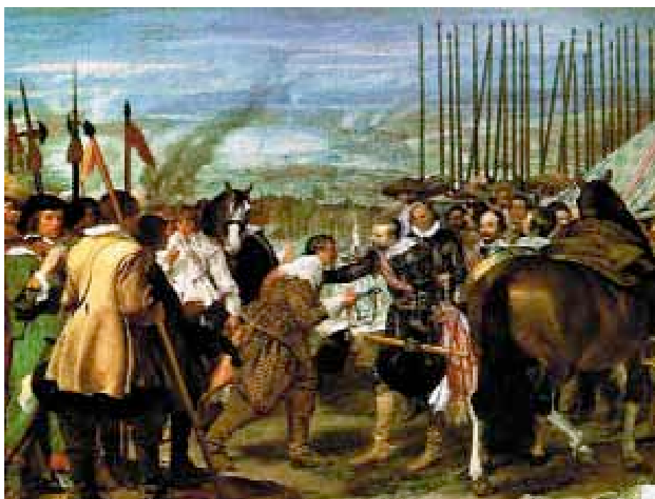
La rendición de Breda , por Velázquez.

También lo es el hecho de que el marqués de Spínola, inmortalizado en el cuadro de Las Lanzas del insigne pintor Velázquez, aparezca portando el suyo horizontalmente empuñado con la mano izquierda mientras que, pie a tierra, recibe caballerosamente las llaves de la rendida ciudad de Breda de manos de su derrotado oponente, el gobernador Justino de Nassau (lo habitual era que se