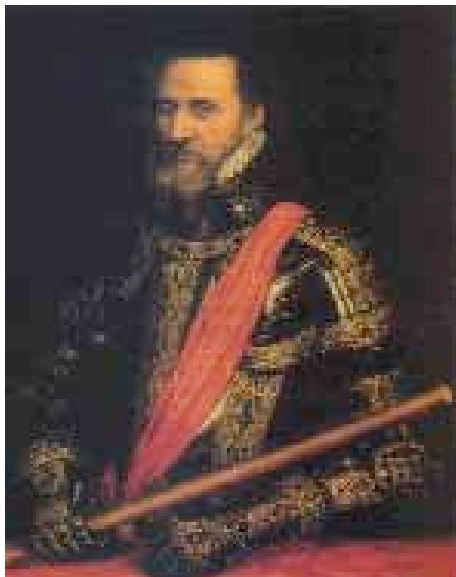
Duque de Alba, por Tiziano.

En origen consistían en cilindros de longitudes y grosores variables sobre los que se podían enrollar de forma helicoidal unas cintas en las que se escribían las misivas siguiendo las líneas marcadas por las generatrices del soporte. Una vez deslizada la cinta, la misiva resultaba ininteligible para todo aquel que no tuviese otro soporte idéntico en el que volverla a enrollar, manteniéndose así la reserva de la comunicación entre los distintos mandos.