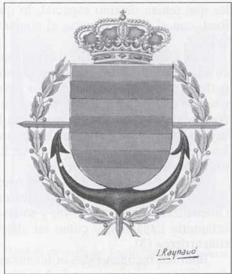
Escudo de armas del Regimiento de Infantería de Córdoba.

El punto de arranque de la moderna Marina fue la Real Cédula de 21 de febrero de 1714, por la que se suprimían los títulos de escuadras regionales y