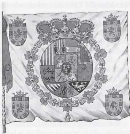
Bandera coronela del Regimiento de Infantería de Córdoba, núm. 2.