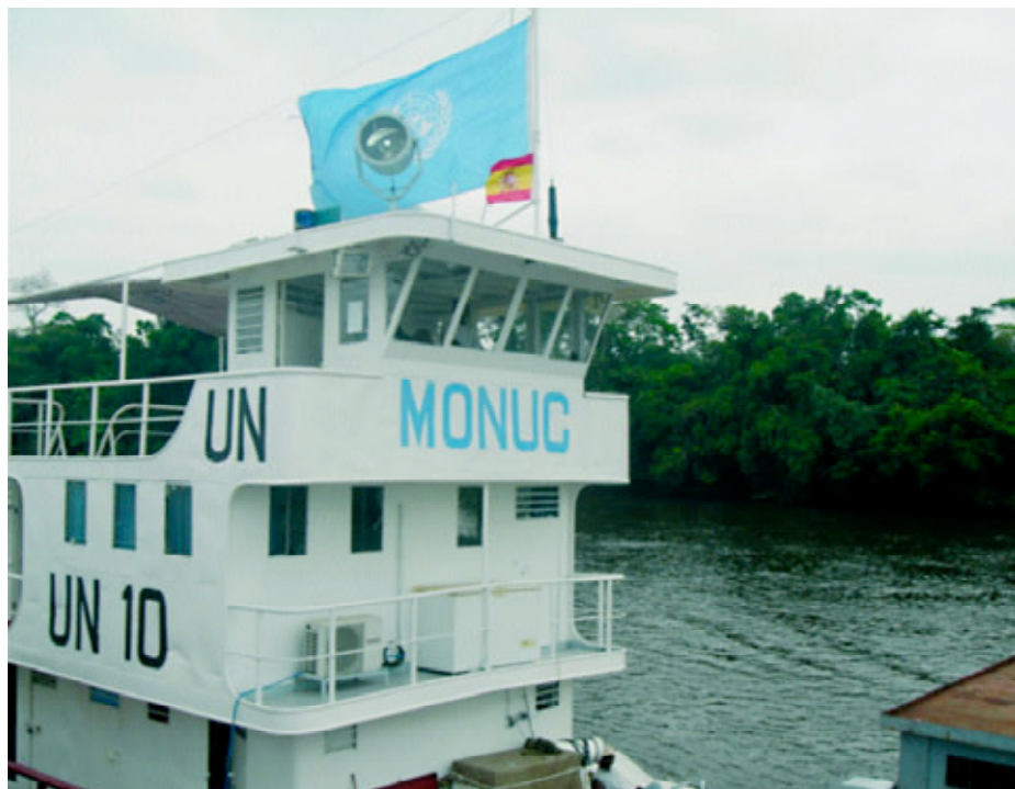
Buque ONU de patrulla fluvial en la República Democrática del Congo.

seguridad del Estado. Ahora la seguridad es cosa de estos últimos, pero también de los servicios de protección civil, de los bomberos, agentes económicos y energéticos, e incluso ONGs. ¿Y los militares? Ya no aparecen al tratar las amenazas a la seguridad que atañen al ámbito del territorio nacional. Entonces nos esforzamos en participar; así nacen la UME o las misiones como la intervención en los dispositivos de lucha contra la inmigración. Elementos todos ellos que, en mayor o menor medida, tratan de asumir cometidos que en principio no tienen mucha relación con lo tradicionalmente militar.