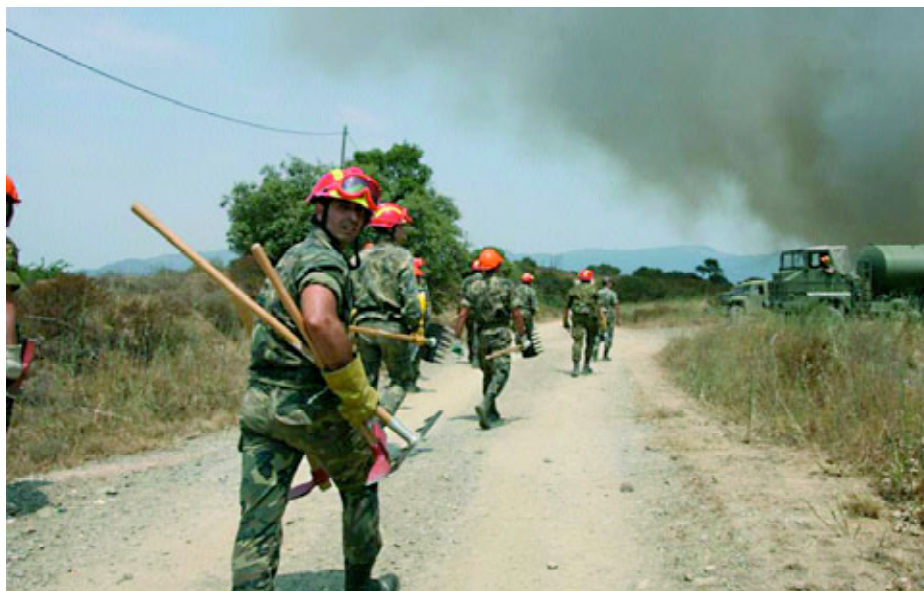
Unidad Militar de Emergencia (UME).

Pero los problemas que se están dando en Afganistán entre las fuerzas participantes y las que también actúan en LIBERTAD DURADERA indican que la OTAN tiene grandes dificultades para afrontar una guerra limitada y para que todos sus miembros concedan la misma relevancia a determinadas amenazas y, por tanto, estén dispuestos a invertir presupuestos para afrontarlas. Tampoco sirve, como así era antaño, para representar el grupo de liderazgo en tecnología y potencia militar... Ya no. La inversión que cada país europeo dedica a la defensa, cada uno priorizando sus peculiaridades, impide que el esfuerzo sea coordinado, realmente eficiente y comparable a la inversión estadounidense o a la china. Por otro lado, la incorporación de los nuevos países de la Europa del Este, más atrasados en medios y personal, impone unos «pies de plomo» a la Organización. No cabe duda que sigue siendo fuerte, pero difícilmente conseguirá una capacidad disuasoria como la que significó frente al Pacto de Varsovia. Hoy en día le falta compromiso político, económico y me atrevería a decir que también operativo para realmente disuadir en un escenario de conflicto limitado.