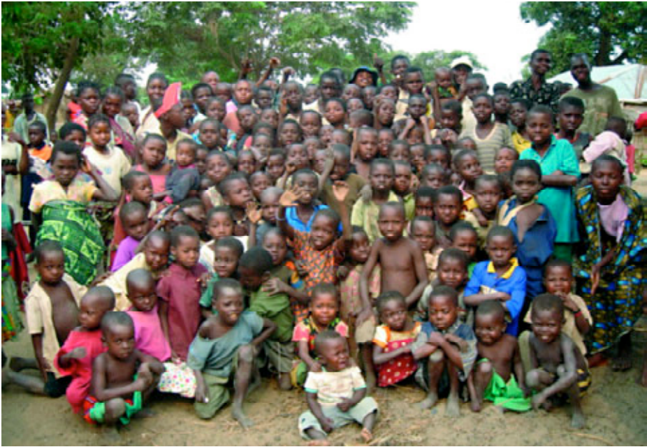
Niños de un poblado WOI. (República Democrática del Congo).

Por tanto, habrá que decidir si queremos ir a la guerra por dinero o por ideales. Y si nos decidimos por los ideales, habrá que encontrarlos. Sin duda tendrán que ver con la defensa del derecho internacional humanitario y de los derechos humanos, de la paz mundial, de la democracia y de las personas mismas. Todos ellos considerados valores universales, al menos en Occidente, y que son más propios de soldados internacionales que de soldados nacionales.