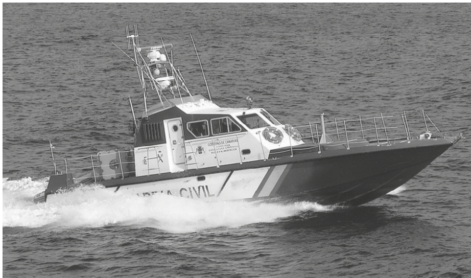
Patrullero de la Guardia Civil saliendo de Gran Tarajal, en Fuerteventura, durante la Operación GUANARTEME.

Control del transporte de especies en veda. Colaboración en el cumplimiento de la legislación sobre contaminación provocada por los buques y sobre aprovechamiento del lecho y el subsuelo marino, así como de las disposiciones relativas a la extracción de áridos y piedras. Colaboración en la protección de cables y tuberías submarinas y de cualquier otra actividad que en cada caso le sea confiada por las autoridades competentes.