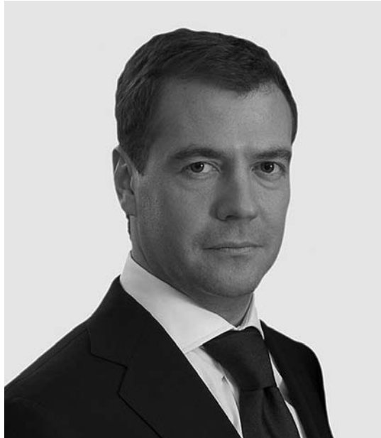
Dimitri Medvédev.

Pocos días antes de la publicación de la Revisión de la Postura Nuclear , los negociadores rusos y americanos cerraron los acuerdos sobre reducción de arsenales estratégicos con un plan que sustituirá al primer START, aprobado en julio de 1991. Los presidentes Medvédev y Obama firmaron en Praga el 8 de abril de 2010 el Tratado