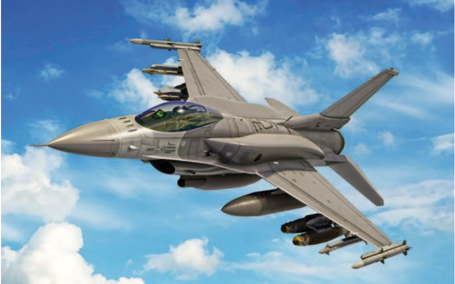
F-16 Block 70.

modernizados con el radar AN/APG-83, si bien el AN/APG-66/67 de los Block 20 es capaz de apoyar el empleo de misiles BVR ( Beyond Visual Range ), incluyendo los TC-2N (versión local del Sparrow y, por ende, de guía semiactiva y alcance medio), así como los excelentes AIM-120-7 (de guía activa y largo alcance), de los que Taiwán ha adquirido 218. Aparentemente, también pueden ser lanzados desde los 130 cazas IDF & Ching-Kuo , que son una versión local del F-16 y cuyo radar (LW-53, también conocido como GD-53) está basado en el APG-66, con algunos componentes del AN/APG-67 integrados). Pero la modernización de sus más de 300 F-5E/F ha sido cancelada (14). Además, Taiwán cuenta con 56 Mirage 2000-5 (de los inicialmente recibidos), dotados con misiles BVR MICA, de los que adquirieron nada menos que... ¡960!