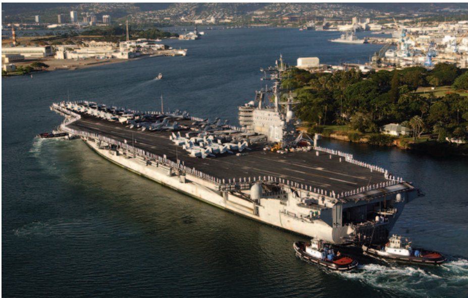
USS Ronald Reagan.

Van Evera, en efecto, se ubica entre el neorrealismo defensivo de Waltz y el ofensivo de Mearsheimer, sin aceptar ninguno de los dos paradigmas, argumentando que ninguna de estas tesis es infalible. Porque las decisiones de los Estados dependerán de algo tan dinámico como es la correlación de fuerzas. El peor escenario deriva de que el más fuerte de la ecuación identifique una tendencia que le lleve a plantear lo que Van Evera califica como Easy Conquest . Eso podría dar al traste con décadas de exitoso equilibrio defensivo para generar una espiral más propia del neorrealismo ofensivo. Es lo que él define como el shift hacia la Offense Dominance . Por lo tanto, eso es lo que hay que evitar, si realmente queremos la paz. Algunos factores geográficos contribuyen (Van Evera, 1998: 19), también en el caso de Taiwán (aunque el politólogo no se refiera al mismo), al predominio de la defensiva, es decir, a evitar el ataque chino: que haya que atravesar el estrecho de Formosa contribuye a ello. También ayuda a disuadir al potencial agresor, diluyendo la sensación de «falso optimismo» que suele preceder a las guerras y a que la sociedad amenazada esté muy cohesionada (Van Evera, 1998: 20). En ese sentido, la defensa del modelo propio de un Estado liberal-democrático de derecho es una baza fundamental para evitar o retrasar el peligroso shift al que antes hemos hecho referencia. Todo ello suma, pero puede no ser suficiente si el territorio amenazado no hace