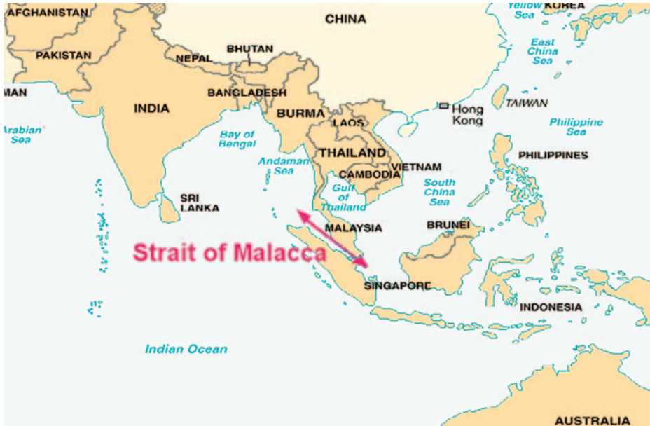
Estrecho de Malaca.

una auténtica potencia marítima, también deberían darse las condiciones adecuadas de carácter nacional y de espíritu comercial reclamadas por Mahan. Están en ello, haciendo progresos.