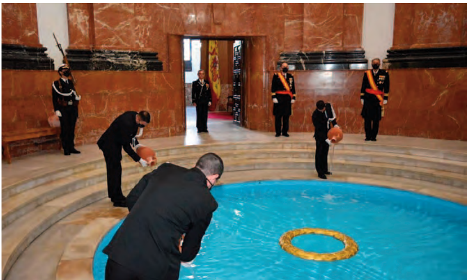
Estanque del Panteón de Marinos Ilustres.

La Victoria , nao capitana, fue la única que alcanzó su destino en la isla de Tidore. A resultas de que la vecina isla de Ternate había sido ocupada por los portugueses, desde su llegada en octubre de 1526 y durante algo más de tres años se entabló una guerra sorda nunca declarada y poco conocida en España entre los dos países ibéricos, guerra en la que se impusieron los portugueses, gracias, principalmente, a la cadena logística que los abastecía desde Malaca. En 1532, cuando los españoles prisioneros de los portugueses supieron que tres años antes los reyes de ambos países habían firmado un tratado por el que las