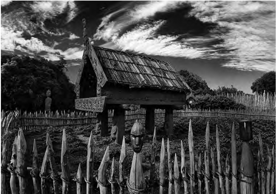
Hórreos en la zona donde pudo naufragar la San Lesmes con sus 50 tripulantes gallegos.

Para finalizar está también el misterio del metrosidero que crece hoy en el mismo lugar del que salieron muchos de los marinos de la expedición de Loáísa, siendo una costumbre bastante extendida entre los navegantes de la época que