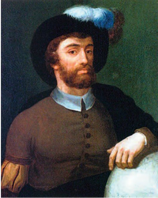
Juan Sebastián Elcano se dejó en la expedición no solo todo su capital económico, sino también la vida. Probablemente murió de ciguatera.