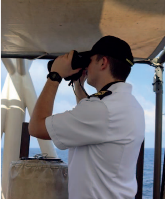
Guardiamarina en el puente.