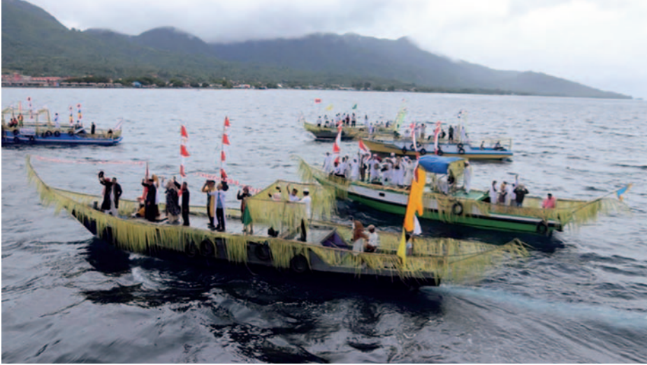
Recibimiento en Ternate.