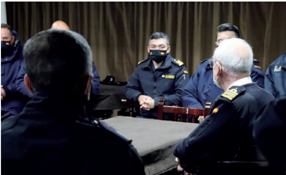
Visita del AJEMA.

A pesar de que el estado de ánimo en estos momentos no era bajo, con el paso de los meses parte de la dotación quería saber a ciencia cierta si se