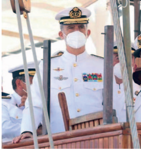
Su Majestad en la llegada a Cádiz.

Sin duda, hubiera sido más fácil saber con certeza y desde un principio que iban a realizar el viaje encerrados a bordo, sin la posibilidad de esparcimiento en los puertos, y con el objetivo de realizar la vuelta al mundo con independencia de la pandemia que lo asolaba, reduciendo la incertidumbre que acompañó