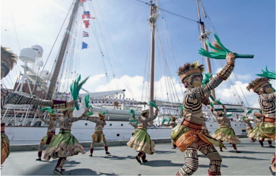
Recibimiento en Cebú.

su dotación. Tras abandonar Filipinas, se tomó rumbo a las Molucas para poner punto y final a los actos de la conmemoración del V Centenario de la primera vuelta al mundo.