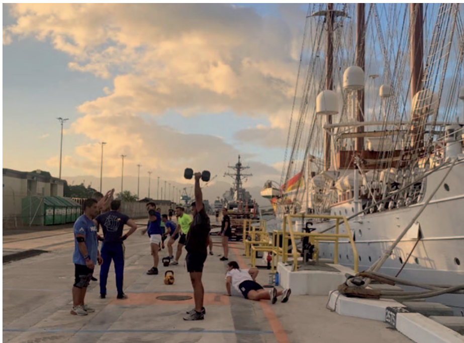
Esparcimiento en un muelle.

era a muchos días vistas, sin puerto próximo en el horizonte. Así, los trabajos, mantenimientos y limpiezas para unos, y las clases, exámenes y conferencias para los alumnos mantenían las mentes ocupadas, desarrollándose el crucero de manera habitual y olvidando la pandemia y sus repercusiones.