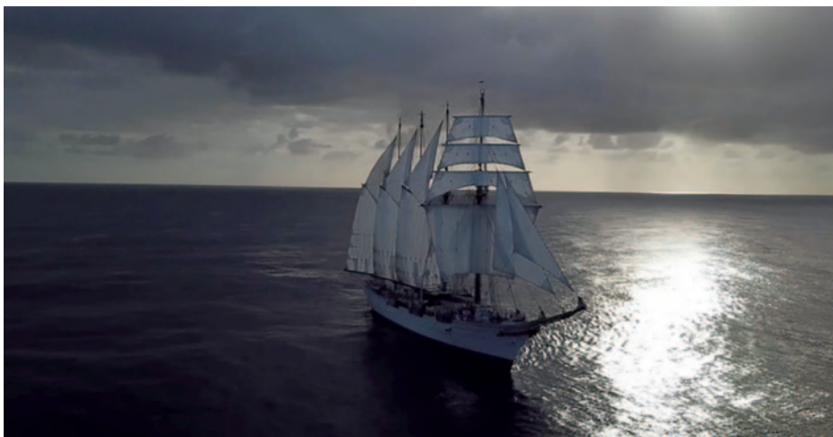
El Elcano navegando a vela.

Las amistades que se forjaron al comienzo del viaje ayudaron en gran medida a aquellos que precisaban apoyo en momentos de flaqueza y siempre tuvieron cerca a alguien que los podía socorrer.