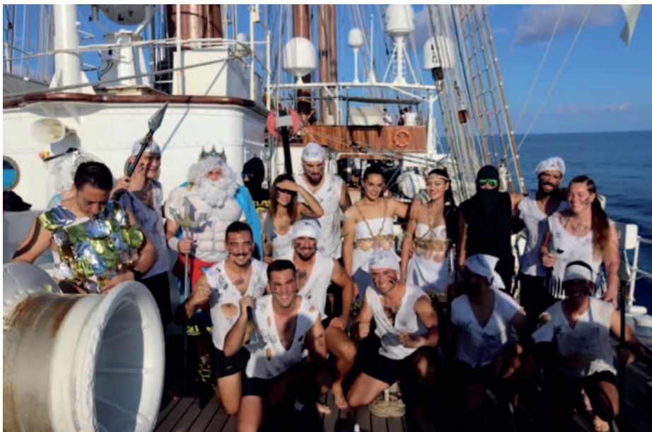
Fiesta del paso del ecuador.

El viaje prosiguió en demanda del estrecho de Magallanes, un punto de inflexión en el viaje, donde el 18 de octubre el buque participaría en los actos organizados para conmemorar el 500 aniversario del descubrimiento del Estrecho en Punta Arenas, donde se esperaban obtener respuestas sobre lo que depararía el resto de la navegación.