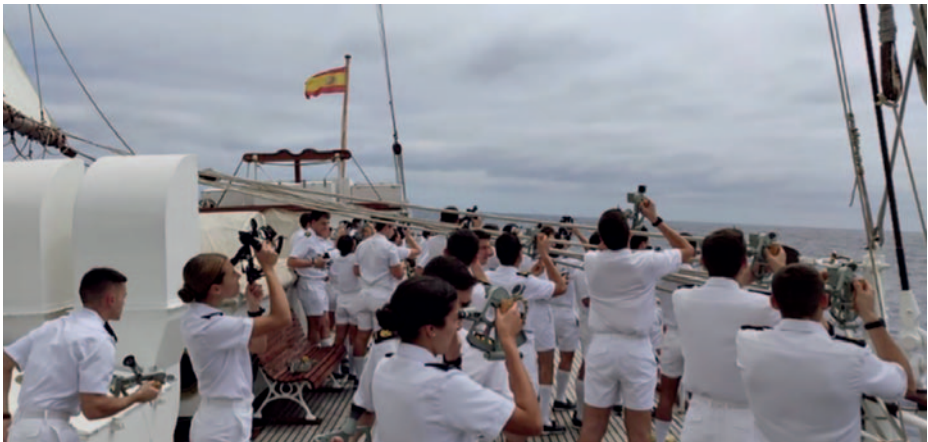
Guardiamarinas observando.

La navegación oceánica se completó a vela casi en su totalidad, a excepción del cruce de la zona de convergencia intertropical. Esta etapa del crucero fue más llevadera, ya que, al ser de tránsitos largos, la mentalidad del personal