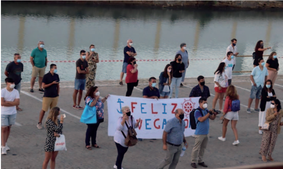
Despedida de familiares.

se aislaron dos días a bordo para conformar una burbuja COVID, que proseguiría durante todo el viaje.