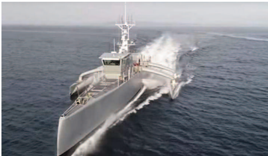
Sea Hunter de DARPA.

El caso de plataformas autónomas de superficie (USV) es especial, ya que la mar seguirá imponiendo sus implacables condiciones. Si realmente se quiere disponer de una flota híbrida oceánica, las unidades autónomas deben estar diseñada para condiciones de estado de la mar y meteorológicas similares a las que se especifican para una tripulada; esto supone que necesariamente habrá que recurrir a vehículos de un considerable desplazamiento, del tipo LUSV (32) y MUSV (33) en el rango de unas 2.000 toneladas de desplazamiento. Estas unidades tendrán que desplegarse por sus propios medios desde su base a la zona de operaciones, lo que supondrá la necesidad de disponer de un amplio apoyo logístico y solucionar problemas técnicos, como el de aprovisionamiento en la mar. Esta es un área aún en sus pasos iniciales, como ya se indicó anteriormente, y la única marina que tiene planes sólidos para adquirir plataformas autónomas oceánicas es la US Navy (34). Después de años experimentando con el prototipo Sea Hunter patrocinado por DARPA, la Marina norteamericana ha iniciado el programa para el desarrollo de tres prototipos de plataformas autónomas oceánicas —dos de superficie de los