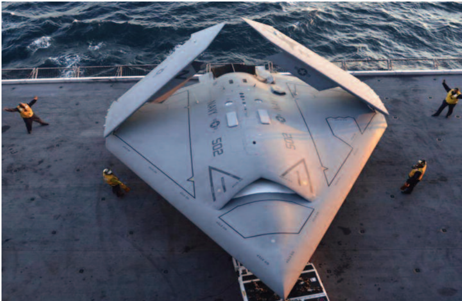
X-47B UCAV de la US Navy.

Una solución híbrida de aplicación aérea naval no es algo que parezca tan inmediato. Si la Armada quisiese mantener la capacidad de ala fija, las opcio-