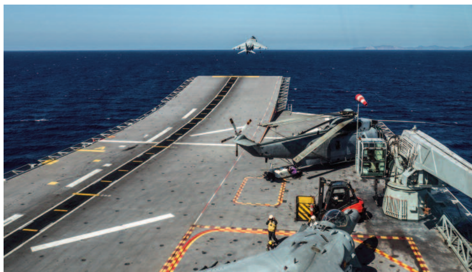
LHD Juan Carlos I.

Si observamos la tendencia de las fragatas en construcción de las marinas de nuestro entorno, parece que, en general, surge un patrón: cubiertas para