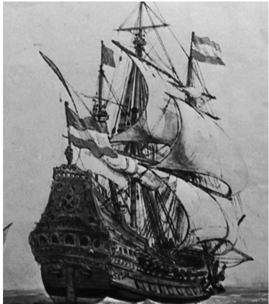
Galeón San José .

España debe despertar del letargo que durante los dos últimos siglos ha mantenido en relación al mar. Con las costas más extensas y variadas de Europa, con dos importantes archipiélagos, uno en el Mediterráneo y otro en el Atlántico, con una historia imperial y un dominio del mar