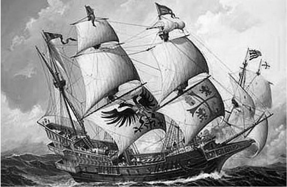
Galeón Nuestra Señora de Atocha .

también a la flota el galeón Santa Margarita , que había sido construido en Cádiz en el mismo año, con un tonelaje menor y que llevaba una carga de mucho menos valor que las veinticinco toneladas de oro colombiano y plata peruana y mexicana que llevaba Nuestra Señora de Atocha . A los pocos días de navegación, fuertes vientos huracanados azotaron a la flota en el estrecho de los cayos de Florida, hundiendo ocho buques, entre ellos Nuestra Señora de Atocha , con una tripulación de 265 hombres. La Corona de España intentó recuperar parte de los restos de la flota hundida, que pertenecían en su mayor parte al Santa Margarita ; sin embargo, el galeón Nuestra Señora de Atocha no pudo ser localizado, ya que al parecer quedó bastante dañado entre los cayos, donde se hundió.