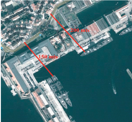
Arsenal de Ferrol.