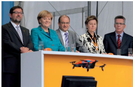
Angela Merkel durante la presentación del Flying-Drone .

de nuevos medios, tales como el cañón láser recientemente instalado a bordo del USS Ponce (3), por motivos técnicos, tácticos, logísticos y económicos.