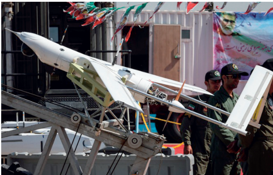
Dron Yasir .

Si bien no hace muchos años solamente podían ser adquiridos por las Fuerzas Armadas (FF. AA.) de los países más desarrollados, actualmente están a disposición no solo de cualquier país, sino también de cualquier persona, aunque no todos poseen las mismas capacidades.