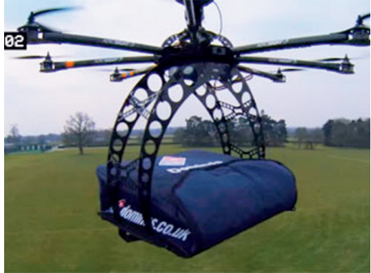
Dron Quadcopter .

Otro uso criminal es el transporte de materias ilegales, que ya ha sido utilizado recientemente por los cárteres de la droga mexicanos, los cuales emplean drones comerciales avanzados para transportar estupefacientes a través de las fronteras, una táctica más económica y segura para los narcotraficantes. Así como el empleo de estos dispositivos