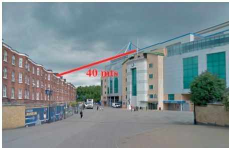
Stamford Bridge Stadium.