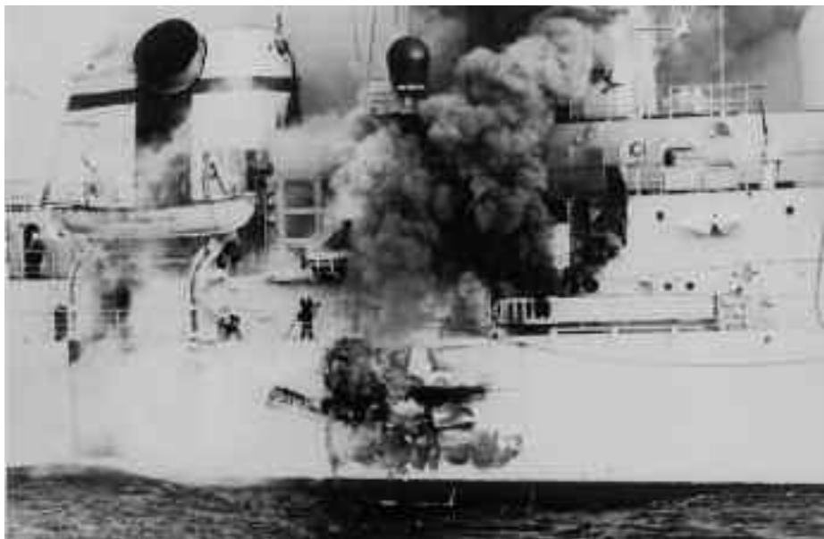
Impacto en el HMS Sheffield .