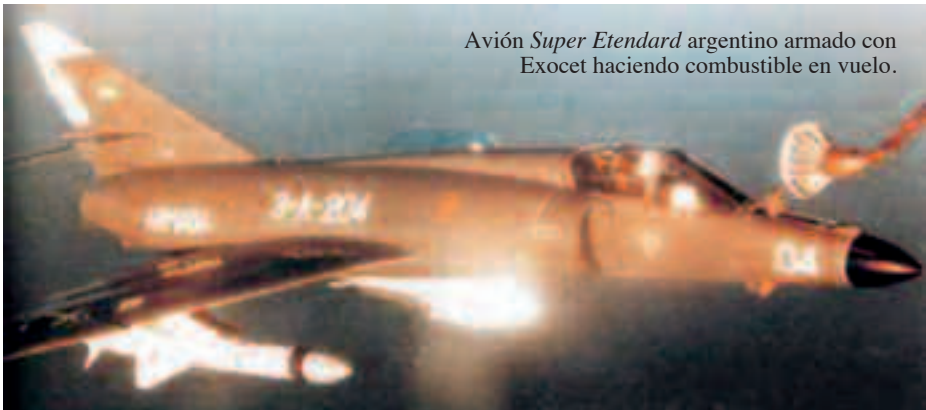
Avión Super Etendard argentino armado con Exocet haciendo combustible en vuelo.