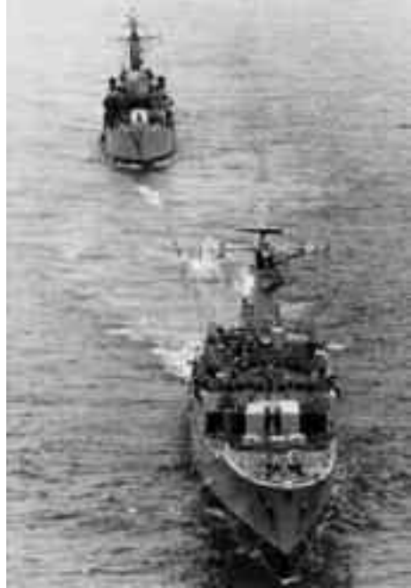
El HMS Yarmouth remolcando al HMS Sheffield .