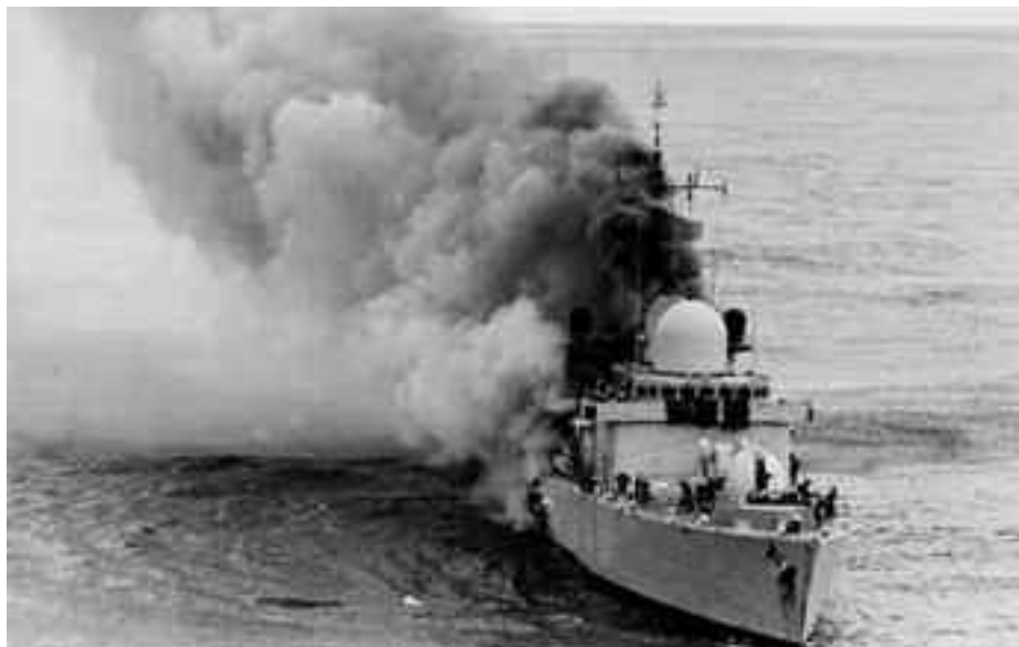
Impacto en el HMS Sheffield .

dad Interior. No se estableció un puesto de mando alternativo de Seguridad Interior, ni se ordenó si quiera zafarrancho de combate. Se crearon tres grupos de personal, uno en el castillo, otro en la cubierta de vuelo y otro en la cubierta 02. La ausencia de megafonía y comunicaciones entre ellos motivó que actuaran independientemente y sin coordinación.