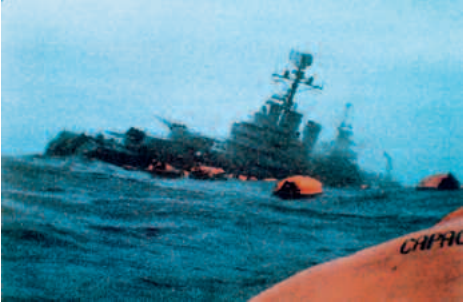
Hundimiento del ARA General Belgrano .

argentino. Este impacto provocó su hundimiento. El 2 de abril la fuerza anfibia argentina había desembarcado en las islas Malvinas. Tras diversos esfuerzos diplomáticos infructuosos, el 1 de mayo los ingleses comenzaron a bombardear las posiciones argentinas en las islas. El día 2, la Royal Navy tuvo su primera acción de combate naval desde la Segunda Guerra Mundial: el submarino nuclear HMS Conqueror hundió con torpedos al crucero de la Armada argentina (ARA) General Belgrano , muriendo 323 marinos.