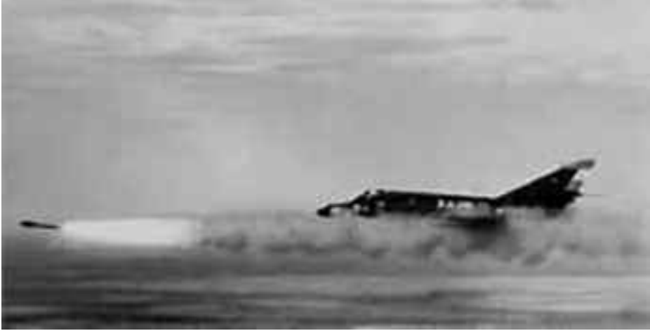
Lanzamiento de un Exocet desde avión Super Etendard argentino.