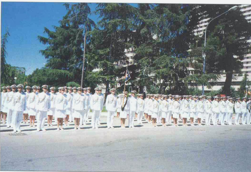
Figura 1. Formación de la Escuela Militar de Sanidad.

En todo momento D. Juan Carlos y D a . Sofía mostraron gran interés por el pasado del Hospital y por los documentos y objetos que se les mostraban.