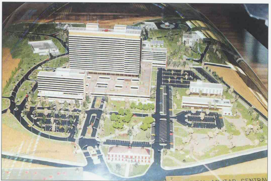
Figura 5. Maqueta del Hospital "Gómez Ulla" tal y como hoy lo conocemos.

El día 22 de junio tuvo lugar una jornada muy especial dedicada al enfermo. Un grupo de teatro anunció alegremente el programa por las plantas de hospitalización y después de una solemne misa de enfermos cantada por el coro de las Hijas de la Caridad, se llevó a cabo la representación humorística de "El enfermo imaginario". Por la tarde se representó un espectáculo de zarzuela a cargo de la Agrupación Lírica