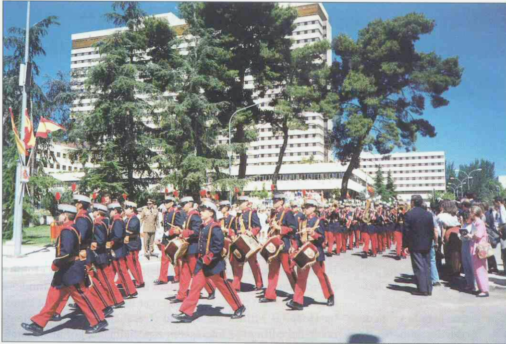
Figura 2. Desfile de la Compañía de Honores.

Desde el Pabellón Histórico la comitiva real se dirigió hacia la entrada del edificio principal del complejo hospitalario donde, después de saludar a los jefes de los diferentes servicios, descubrieron un monumento conmemorativo del Centenario, obra en bronce de la escultora Paz Figares en la que se muestran en relieve figuras alegóricas de la medicina castrense y escenas de la asistencia sanitaria militar a través de la historia.