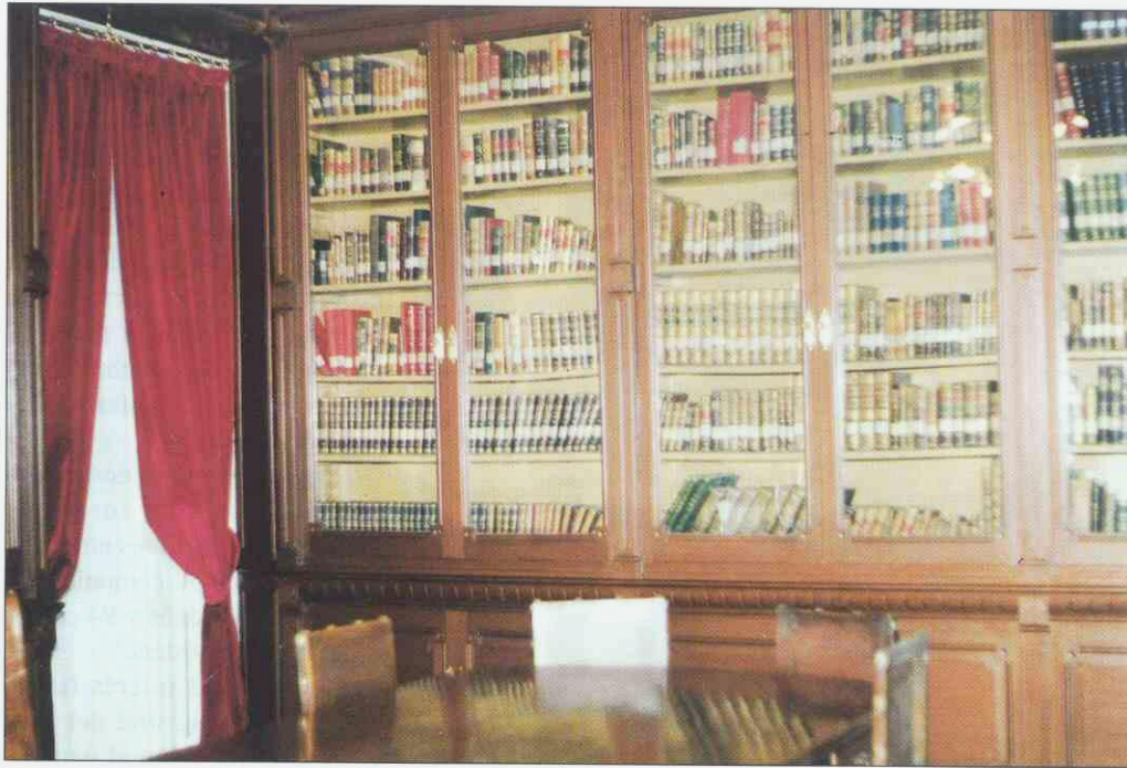
Figura 4. Biblioteca histórica.

estudio y la dedicación serena y paciente que lleváis a cabo se une a los desvelos de tantos que, como vosotros a lo largo y ancho del mundo, luchan para contribuir a paliar el dolor y el sufrimiento del ser humano.