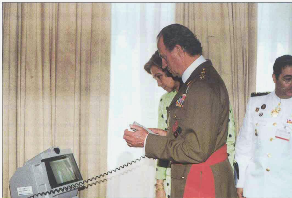
Figura 6. SS. MM. en conexión vídeo-telefónica con las tropas destacadas en la antigua Yugoslavia.