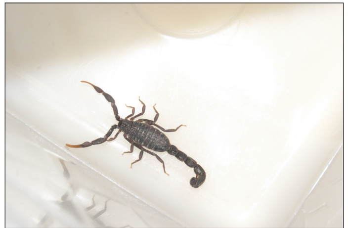
Figura 2. El escorpión pertenecía a la familia Buthidae .

A pesar de que el protocolo de actuación no está claramente establecido 5,10 , el pilar sigue siendo el tratamiento de soporte. Tras una primera evaluación ABC, y en presencia de criterios de gravedad, dos vías de grueso calibre deben colocarse tan pronto como sea posible. Asimismo, deberían realizarse un análisis sanguíneo completo, un estudio radiológico y un ECG. La utilización de suero específico todavía sigue siendo controvertida. No