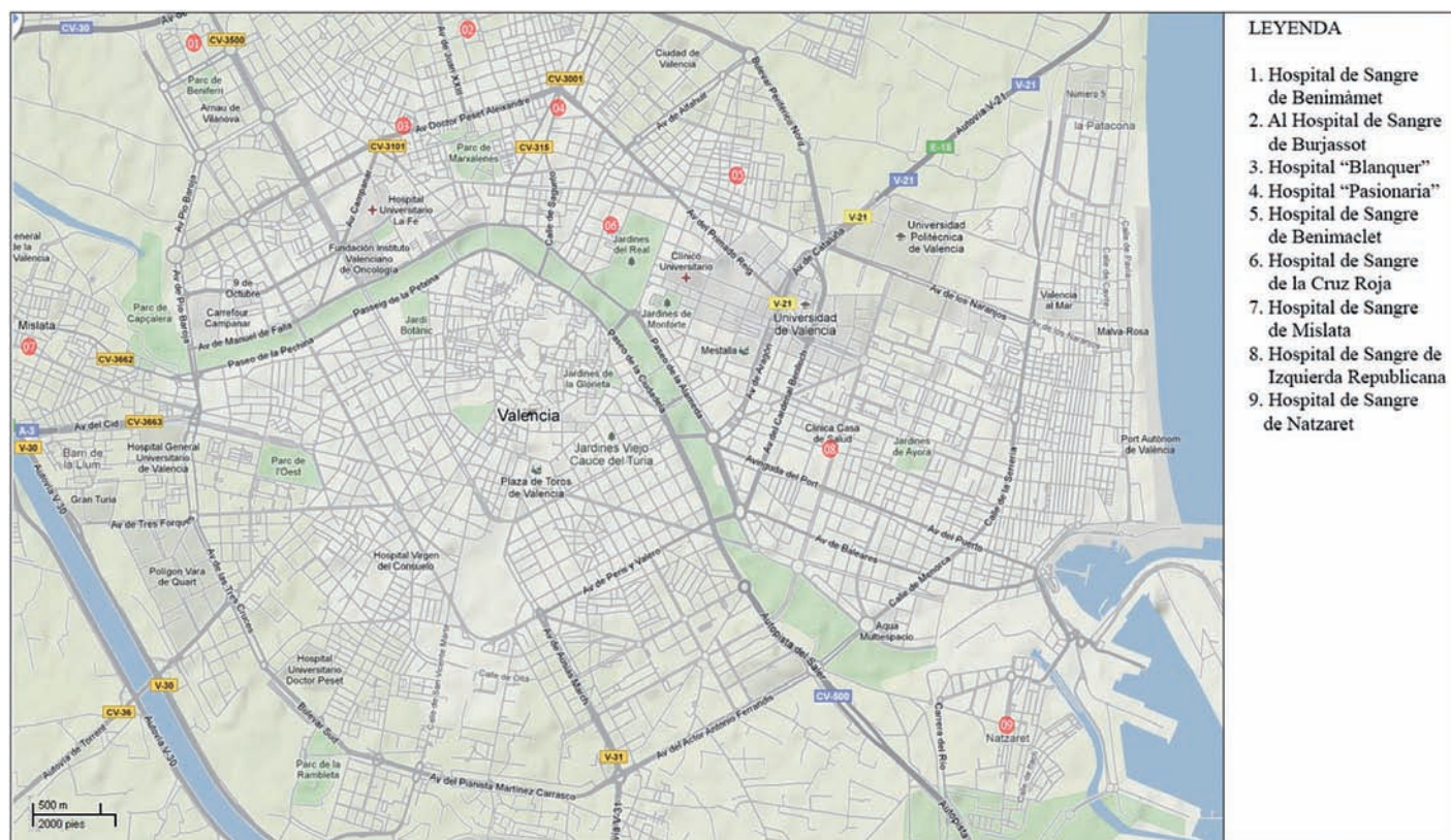
Figura 1. Hospitales de sangre en Valencia durante la Guerra Civil Española.

Del análisis de esta Orden se desprende la intención del Gobierno de centralizar los grandes hospitales existentes en la zona republicana a través de un proceso de militarización. Sin embargo, si comparamos esta disposición con la que se aplicó en Madrid durante el verano de 1936 nos daremos cuenta de que la centralización sanitaria que se llevó a cabo a partir de 1937 fue mucho más intensa, dado que el Decreto de 1936 ordenaba el cierre de los hospitales con una capacidad inferior a las 50 camas, mientras que la Orden de 1937 establecía el límite de viabilidad en 300.