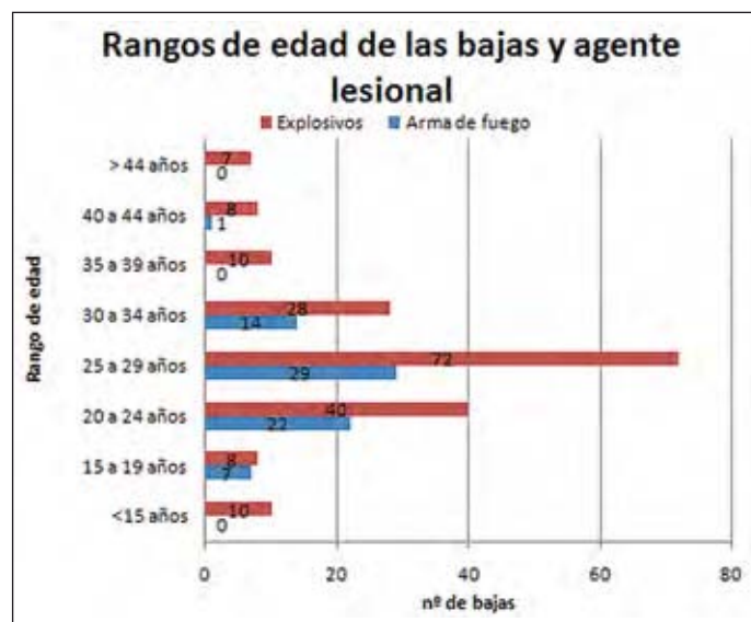
Figura 2. Rango de edad de las bajas y agente lesivo (n).

El médico militar, debe tener una instrucción completa en esta área, ya que como facultativo ha de conocer la fisiopatología de las lesiones por arma de fuego y por explosivos y como oficial tiene la obligación de defender a sus pacientes en las unidades sanitarias desplegadas en Zona de Operaciones. Analizando las heridas puede llegar a reconocer el empleo de nuevas armas por parte del enemigo, e incluso colaborar en el diseño de medidas de protección para los soldados.