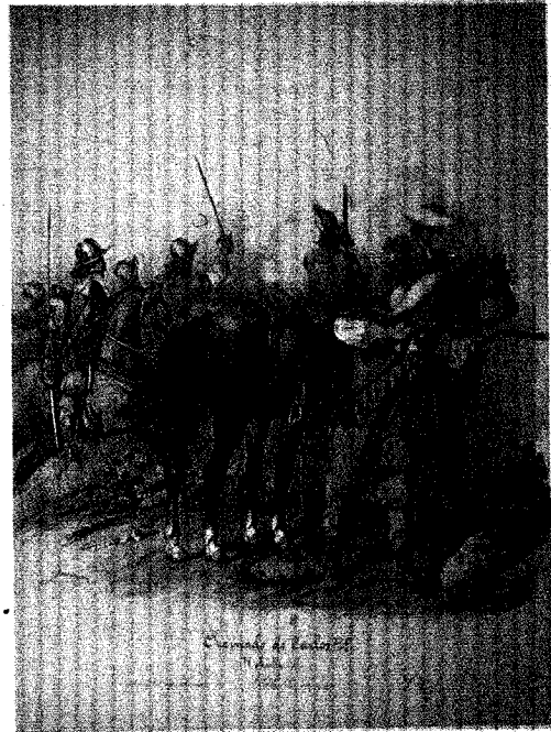
Reinado de Felipe III; Tropas de la Casa Real: Caballería: Archeros de la cuchilla, Infantería: Alabarderos de las guardias española y tedesca. Reinado de Carlos II; Caballería: Caballos corazas, Dragones.