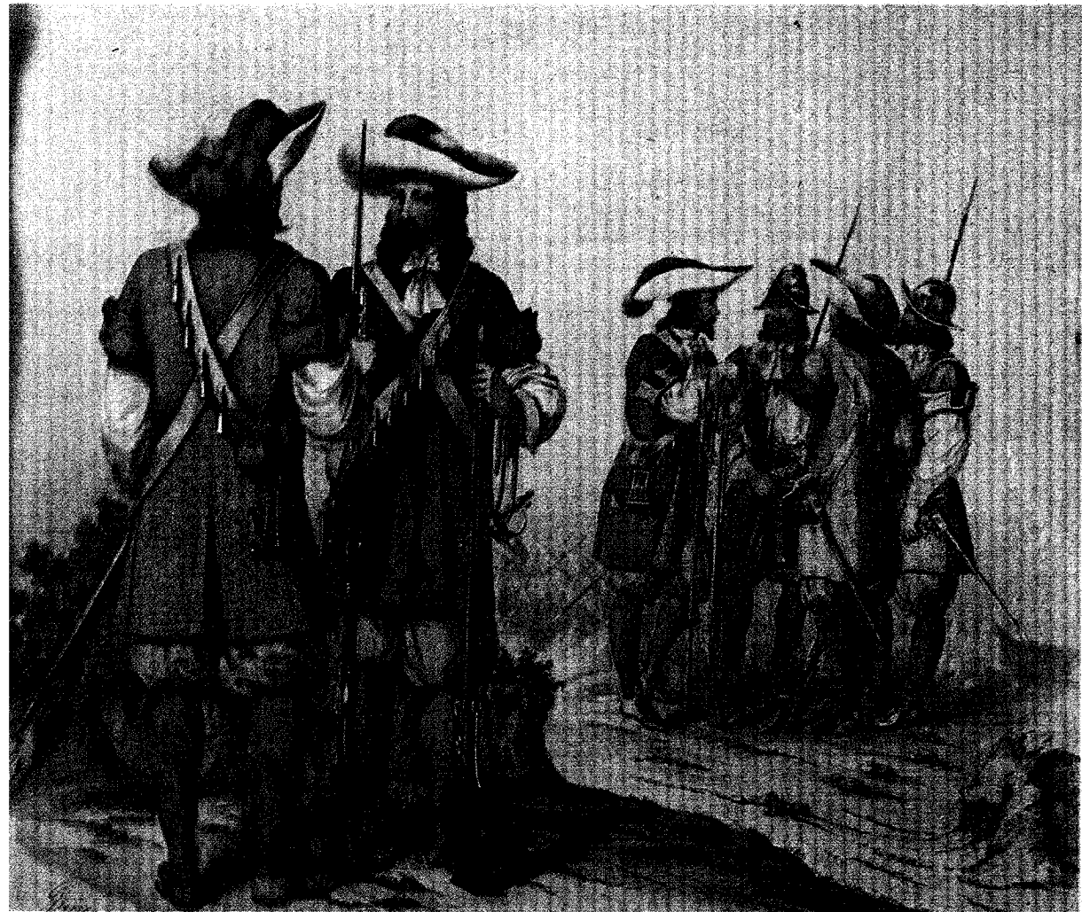
Tercios Provinciales de Infantería del reinado de Carlos II. Del álbum del Ejército y la Armada de Manuel Giménez y González.