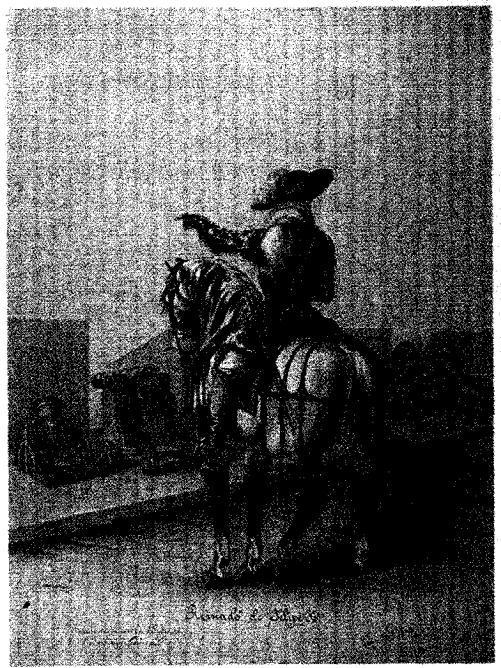
Reinado de Felipe IV; Caballería: Caballos carabinas, caballos corazas, primeros Dragones. Reinado de Felipe III; Mando Superior en el Ejército: Capitán General, Artillería: Piezas de posición.