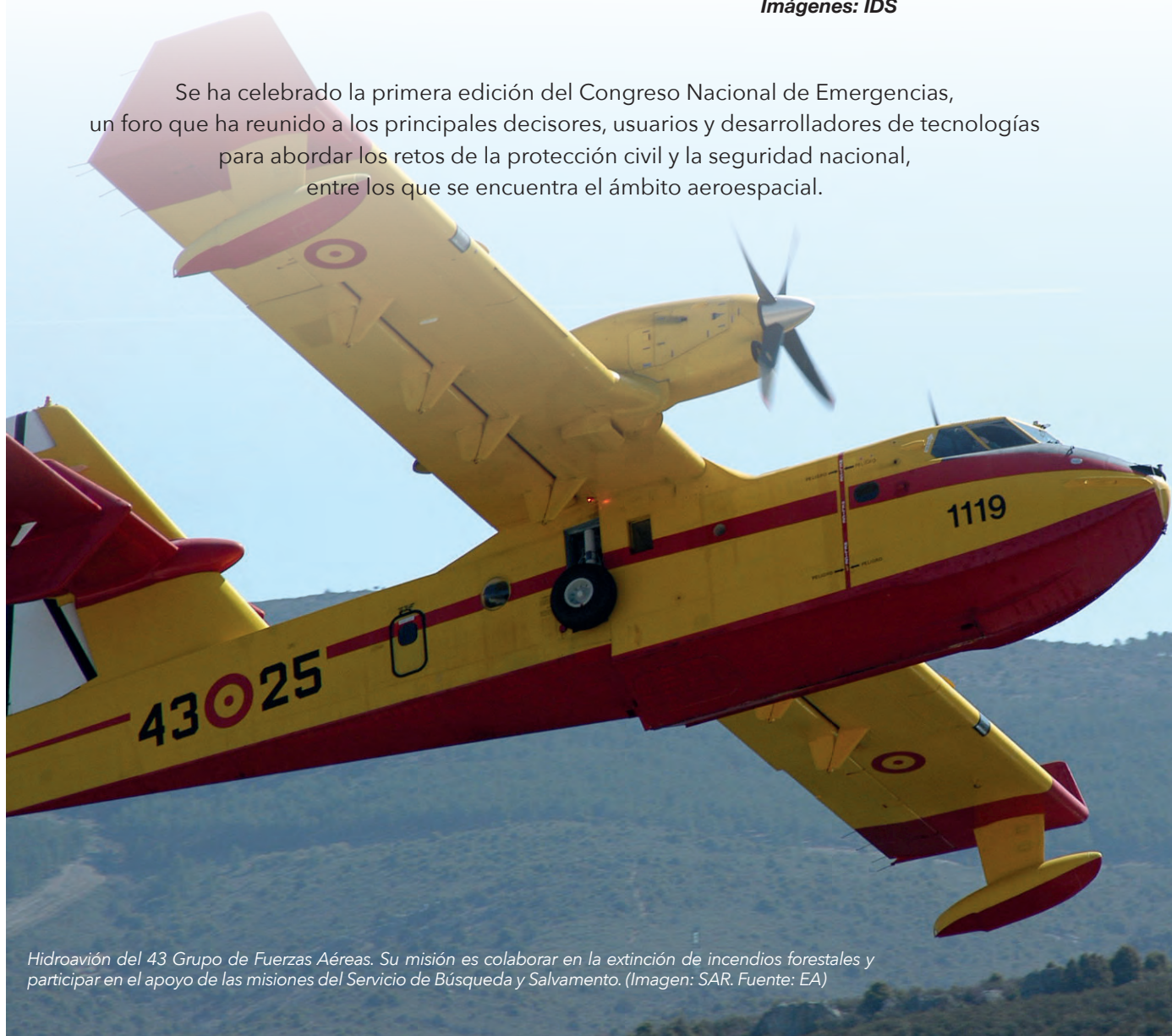
Hidroavión del 43 Grupo de Fuerzas Aéreas. Su misión es colaborar en la extinción de incendios forestales y participar en el apoyo de las misiones del Servicio de Búsqueda y Salvamento.

Se ha celebrado la primera edición del Congreso Nacional de Emergencias, un foro que ha reunido a los principales decisores, usuarios y desarrolladores de tecnologías para abordar los retos de la protección civil y la seguridad nacional, entre los que se encuentra el ámbito aeroespacial.