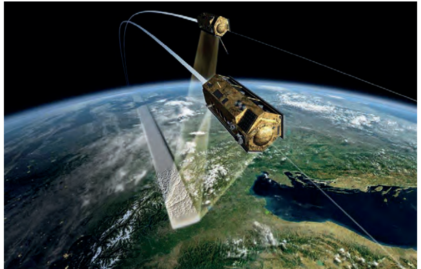
El satélite Paz tienen la capacidad de tomar más de 100 imágenes al día para la gestión de emergencias.

Del conjunto de conferencias cabe destacar las que abordaron las necesidades operativas con tres itinerarios monográficos: sobre riesgos naturales, riesgos tecnológicos y medioambientales y riesgos derivados de la actividad humana. Numerosas compañías del ámbito aeroespacial pudieron presentar sus novedades tecnológicas así como participar en una serie de demostraciones sobre nuevos sistemas, destacando el traslado de personas en aislamiento portátil y el reconocimiento en lugares de difícil acceso mediante drones.