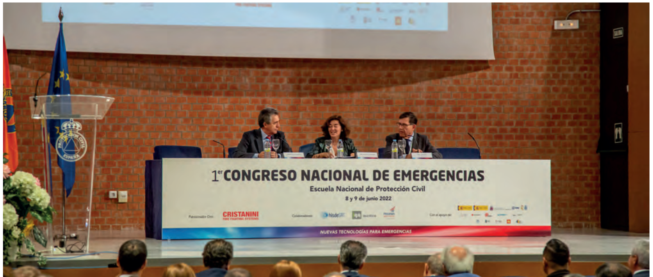
El objetivo es ofrecer tecnologías para abordar los retos aeroespaciales de la protección civil y la seguridad nacional.

En el caso del satélite Paz, toma más de 100 imágenes al día para, entre otros, el servicio de vigilancia marítima. En el caso de las inundaciones, se identifica la lámina de agua, es decir, como se está cubriendo de agua una zona o un núcleo urbano, y luego se lleva a la cartografía. La tecnología permite identificar qué vías están cortadas para encontrar alternativas. Otro caso se ha dado con las erupciones volcánicas, porque permite seguir el crecimiento de las coladas que se producen y la deformación del terreno. Así, el servicio de medidas de deformación del terreno en zonas urbanas e infraestructuras permite garantizar la seguridad de los ciudadanos. En el ámbito de las catástrofes medioambientales, se realizan proyectos para la identificación de las manchas del petróleo en alta mar.