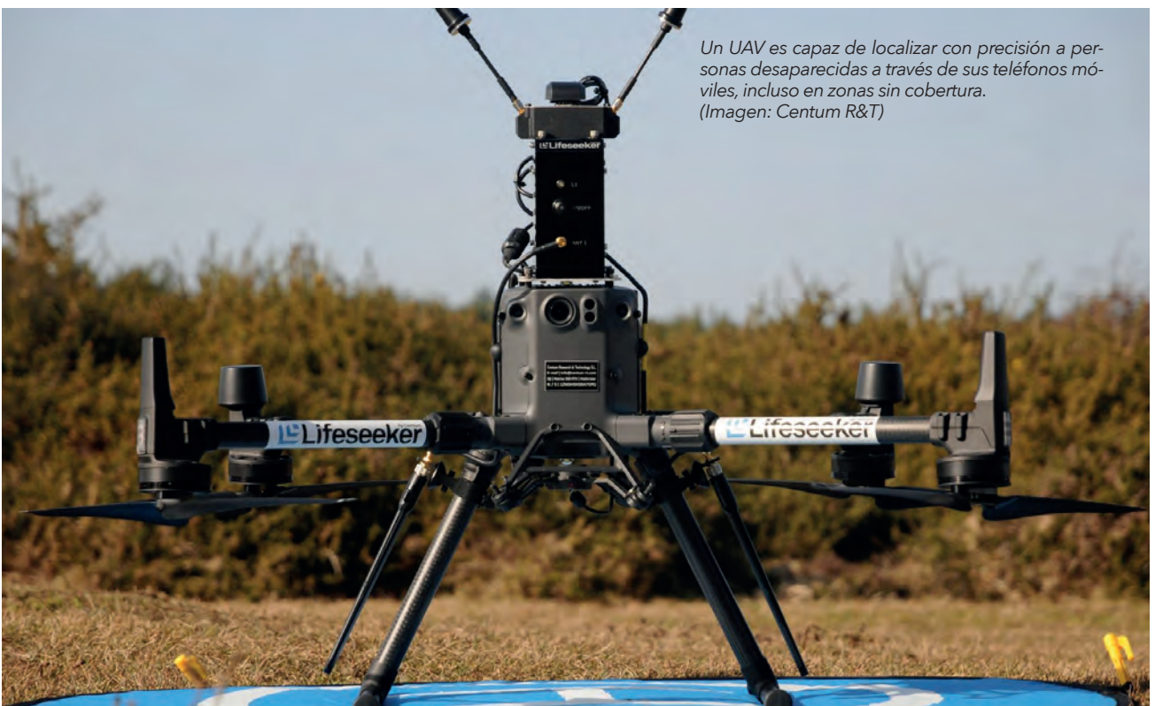
Un UAV es capaz de localizar con precisión a personas desaparecidas a través de sus teléfonos móviles, incluso en zonas sin cobertura.

tres veces más autonomía y alcance que cualquier multicoptero, con dos versiones, una de 4,2 kg y otra de 25 kg; además, con cinco kilos se podría desplazar 90 kilómetros de distancia. Puede lanzar sensores antincendios en zonas apagadas para crear un mapa de probabilidad de reinicio de fuego, que es lo que más sufren los cuerpos y las brigadas de emergencias. ■