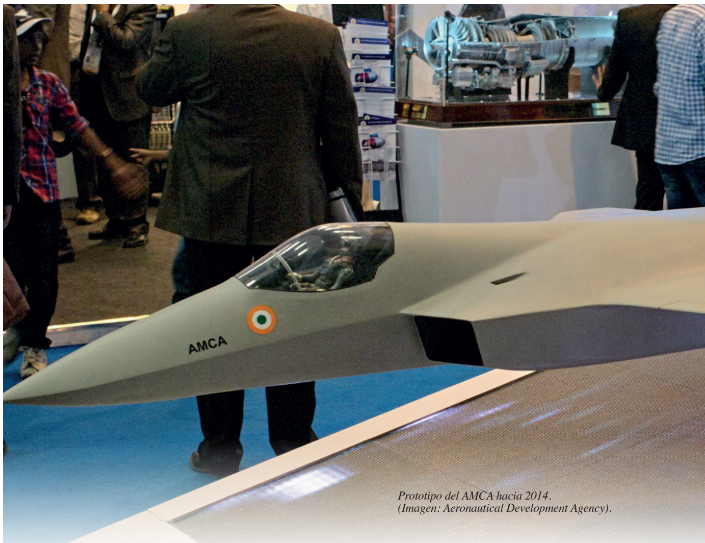
Prototipo del AMCA hacia 2014. (Imagen: Aeronautical Development Agency).