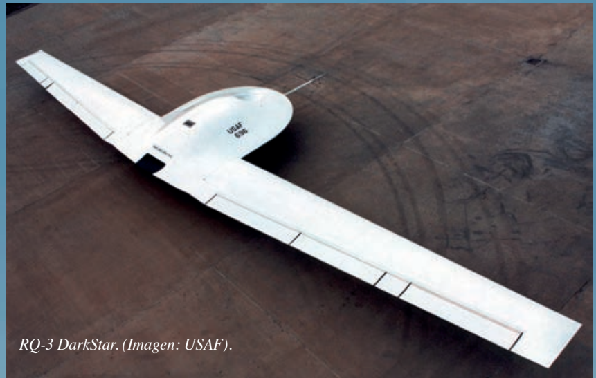
RQ-3 DarkStar.

La entrada en servicio tanto del bombardero B-2 Spirit como del F-22 Raptor prevista a comienzos del siglo XXI, junto con el inicio del programa Joint Strike Fighter (JSF) así como la fuerte inversión realizada por Estados Unidos en el desarrollo de UAVs ( Unmanned Air Vehicle ) en los años 1990 y que originó tanto el RQ-1 Predator (entrada en servicio en julio de 1995 y retirado en 2018) como