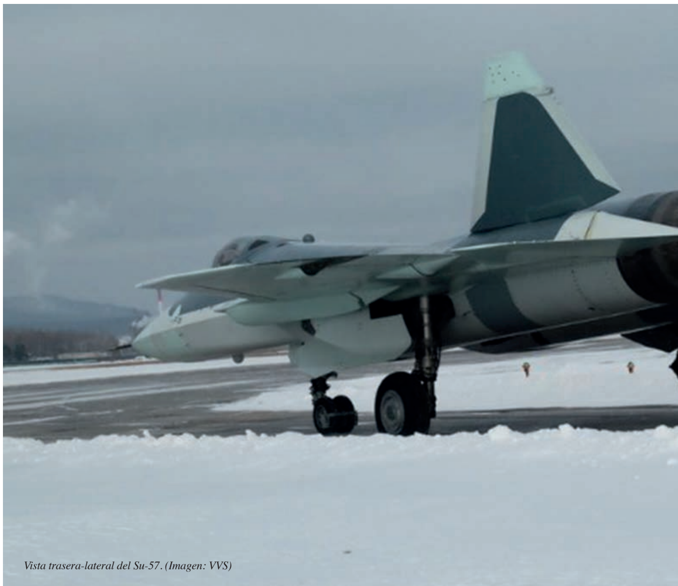
Vista trasera-lateral del Su-57.

cuyo alcance solo puede ser estimado. Es este punto, sus sistemas de búsqueda y seguimiento de objetivos se dividen principalmente en dos grupos: un sistema electro-óptico 101KS-V, y la suite radio-electrónica Sh121, que engloba la suite radar N036 y el sistema de guerra electrónica L402. La suite N036 Byelka está formada por un total de 5 radares AESA (Active Electronically Scanned Array), operando tres de ellos en la banda X y otros dos en la banda L (lo que le proporciona una ventaja significativa en la detección de blancos aéreos con cierta/total capacidad stealth , en cuanto el diseño aerodinámico de