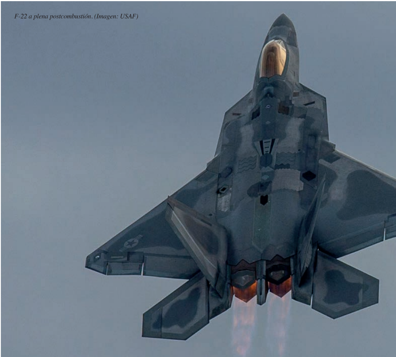
F-22 a plena postcombustión.

ejemplo, los Phase Enhancements que están planificados para el programa Eurofighter, algunos de los cuales ya se han implementado, con pleno éxito.