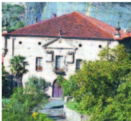
Casa-torre de los Moyúa (Vergara)