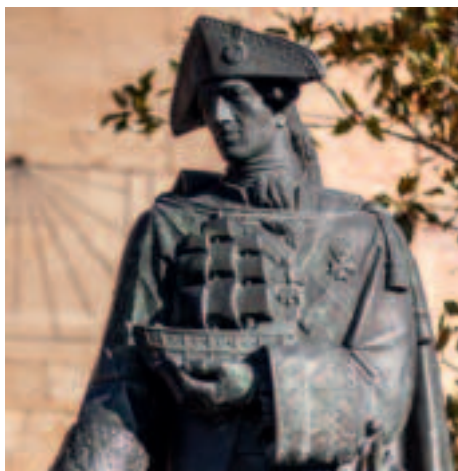
Detalle de la estatua dedicada a Antonio Valdés en Fuenmayor (La Rioja)

sus órdenes: «Envío la orden para el destino de tu sobrino como lo pides y en esto acreditarás el deseo que tiene de servirte en cuanto tenga arbitrio tu verdadero y fiel amigo» 10 .