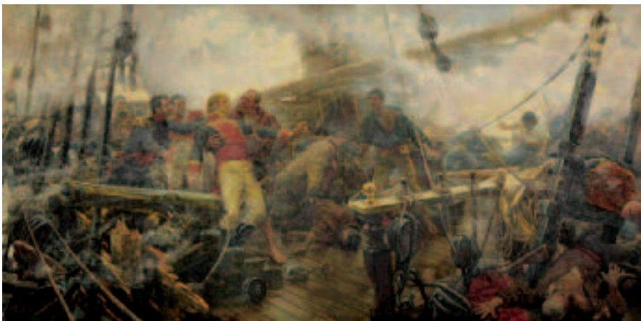
E. ÁLVAREZ DUMONT: Muerte de Churruca en Trafalgar . Museo del Prado

Su madre, mi hermana, disfrutará del alivio de su pensión del montepío militar con la gracia a que la fraternal piedad de S.M. ha querido extender las resultantes del día 21 de octubre, pero ya es casi septuagenaria y se encuentra en un estado de suma debilidad.