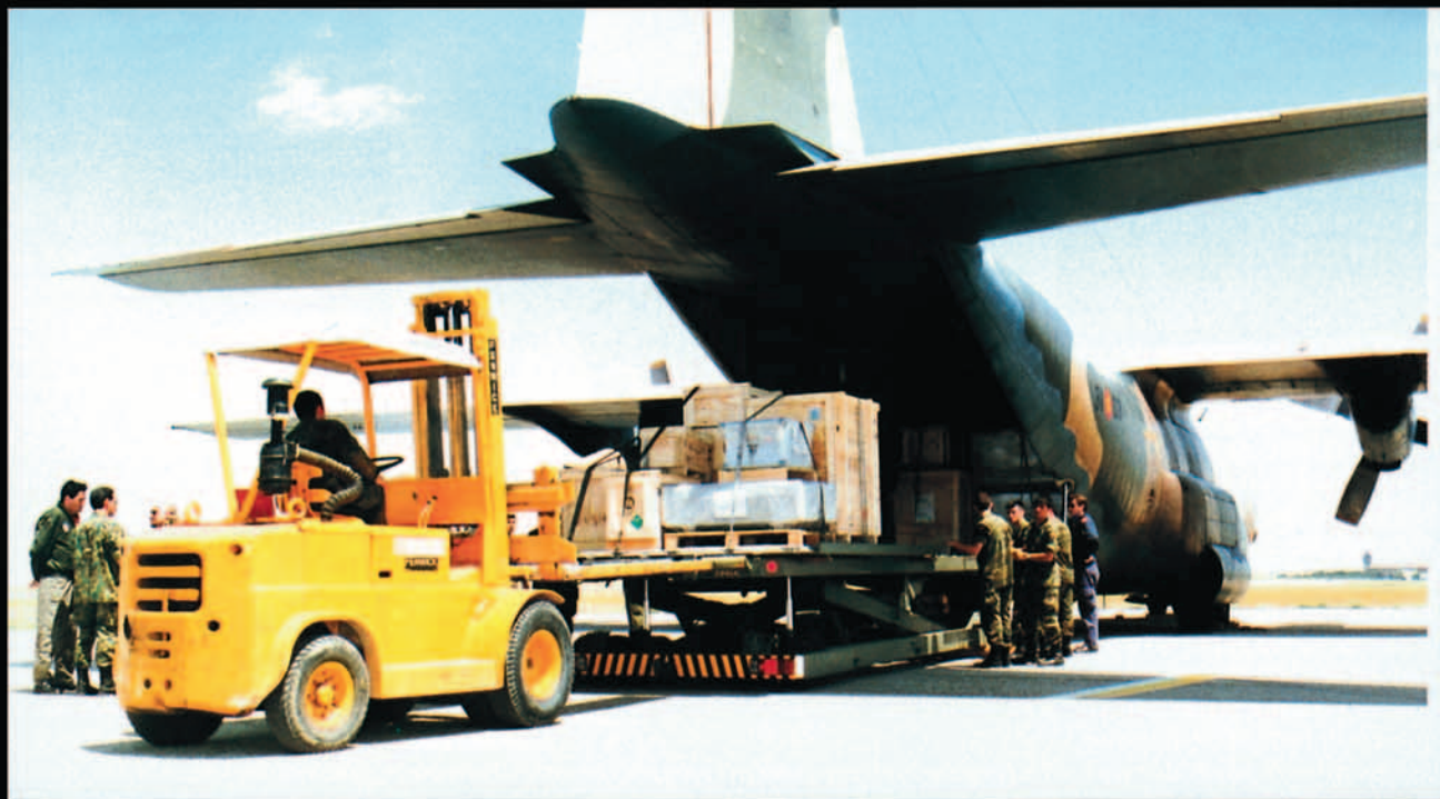
Una de las SATA,s móviles en acción.

trol de combate (CCT), que con su sacrificio y esfuerzo se preparan, no sólo para atender los PLIC, con su control, señalización y lanzamientos Halo-Haho, sino que se preparan para apoyar las operaciones y ejercicios que requieran su presencia.