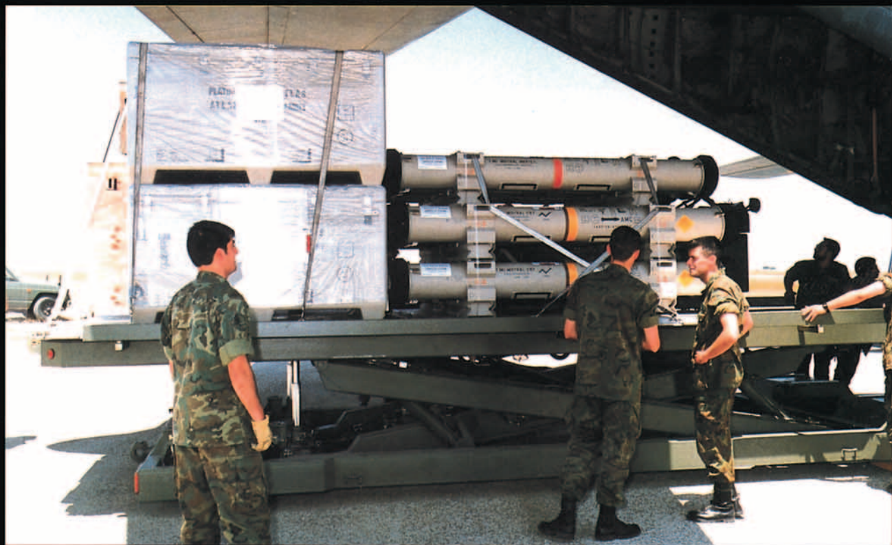
Llegada a la Base Aérea de Zaragoza del Mistral.

La sección de Apoyo al Transporte Aéreo , al mando de un capitán, consta de tres SATA,s móviles equipadas con transferidores y uñas de diversas prestaciones y de tres equipos de control de combate capaces de operar en cualquier condición, terreno y circunstancia. Esta sección tiene la responsabilidad de proporcionar el material y el personal necesario para que las unidades de transporte del Ejército del Aire puedan llevar a cabo su entrenamiento y alcanzar los niveles operativos que se requieran. Este entrenamiento se realiza en los planes de instrucción de lanzamientos de caras (PLIC,s) que se vienen realizando en la Base Aérea de Villanubla y el Aeródromo de Ablitas, donde se lanzan cargas y personal en