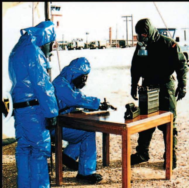
Punto de registro y control en una estación de descontaminación NBQ de personal.

Con este resumen se pretende dar a conocer una unidad del Ejército del Aire, que a pesar de su juventud, posee la experiencia de su antecesora, las ganas de trabajar de un personal que día a día demuestra su profesionalidad y con el suficiente empuje para poder ganar la apuesta del futuro ejército profesional ■