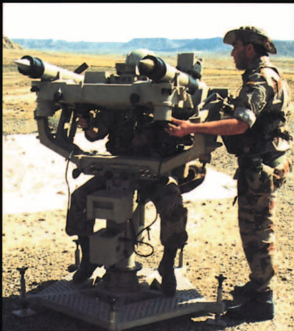
Un lanzador Atlas operando en el polígono de tiro de Bardenas.

mentar el material de que constará el sistema mixto Espada-2000 de misiles Mistral (I/F) y Aspide (EM) con un radar de detección bidimensional con un alcance aproximado de 40-50 Kms. con IFF/SIF, del que dependerán dos secciones de fuego con radar de seguimiento y tiro y dos lanzadores dotados de seis misiles Aspide 2000 cada uno, además de los tres lanzadores Atlas que se integrarán en el centro de detección, que a su vez tendrá capacidad para integrarse en el sistema de defensa aéreo del Ejército del Aire, a través de Link. En la actualidad se realizan ejercicios con el sistema Atlas, en el que cada lanzador dispone de dos misiles Mistral y que se integra en los despliegues que se realizan con el Ejército de Tierra en aquellos ejercicios en que el mando lo considera necesario, además de los específicos de la sección, donde gracias a las posibilida-