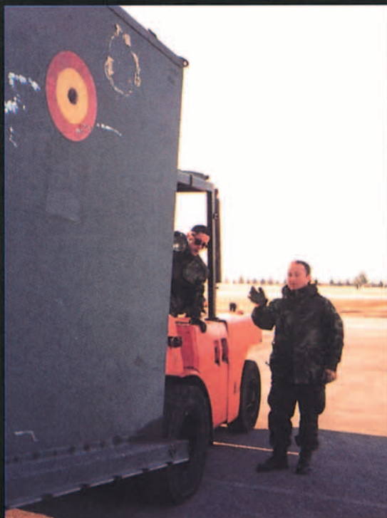
Parte de la SATA móvil en la Base Aérea de Aviano.

La sección SHORAD , está mandada por un capitán y se encuentra en fase de comple-