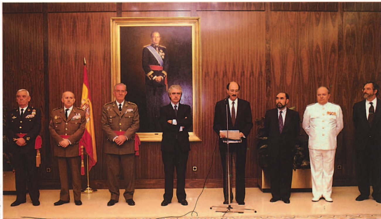
Gustavo Suárez Pertierra tomaba posesión de su cargo el día 3 de julio, con una experiencia acumulada de nueve años en la gestión de defensa ocupando la Subsecretaría del Ministerio y la Secretaría de Estado de Administración Militar.

En el cuadro 1 se refleja un resumen de los datos más significativos en relación con la participación española en el conflicto.