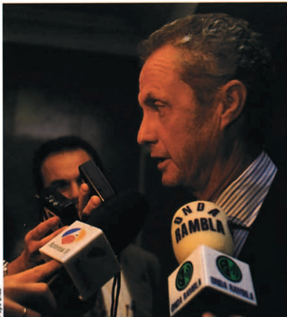
Pedro Morenés Eulate, secretario de Estado de la Defensa.

El 27 de febrero el ministro de Defensa promulgó la Directiva 38/96, que regula el Proceso de Planeamiento de la Defensa Militar anteriormente contemplado en la Directiva 13/90 y entre otros aspectos, encomienda al jefe del Estado Mayor de la Defensa la dirección y coordinación de todo el proceso de planeamiento de la defensa militar.