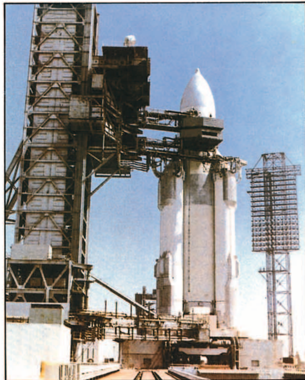
La nave recuperable Burán preparada para ser lanzada por el cohete Energía, el más potente del mundo. A la derecha otra vista del Energía.

el espacio logrados por su país, a cambio de ayuda en un programa que podría suponer más de 80.000 millones de dólares: "Hagamos un vuelo a Marte y no la guerra" se podría decir.