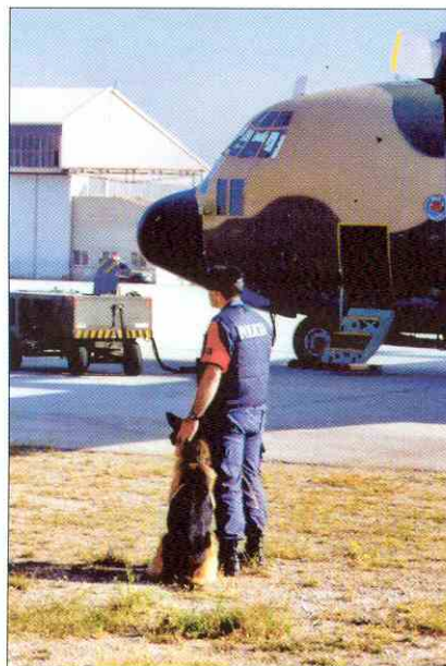
La protección de nuestra Fuerza Aérea exige profesionales preparados para su Seguridad, Defensa y Apoyo a su despliegue.

La misión encomendada a la ETESDA requiere la implantación de diferentes programas de formación y perfeccionamiento cuyo desarrollo puede extenderse desde 2 semanas hasta todo un curso escolar depen-