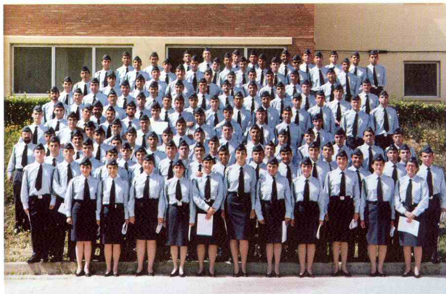
La ETESDA es el Centro de Enseñanza del Ejército del Aire donde se forman más profesionales cada curso. El 22% es personal femenino.

Todas estas actividades agrupadas según los objetivos que se pretendan alcanzar dan lugar a la programación de 7 cursos diferentes de formación específica para militares profesionales de tropa y marinería (Seguridad y Defensa, NBQ y Contraincendios, Combustibles, Auxiliar de supervisor de carga, Zona de vuelos, Hostelería y Apoyo al personal) 3 cursos de formación para la obtención de la especialidad de Seguridad y Defensa, 2 cursos informativos sobre Seguridad y Defensa, 2 cursos de Guías y Adiestramiento de Perros Policías, 2 cursos de Protección de Autoridades y 1 curso de Hostelería.