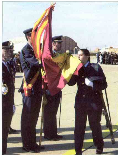
Los aspirantes a Militar Profesional de Tropa y Marinería aprenden en esta Escuela lo que es la Institución Militar, sus normas y sus valores. Esta formación será la base de cuantas actividades desarrollen durante su permanencia en nuestro Ejército.

Las enseñanzas que se imparten pretenden proporcionar a los profesionales las habilidades necesarias que les sirvan de base para hacer frente a las distintas agresiones que pueden sufrir las personas, los medios y las instalaciones con que cuenta nuestra Fuerza Aérea para operar en un ambiente lo más seguro posible. Por tanto, las actividades que se desarrollan, se re-