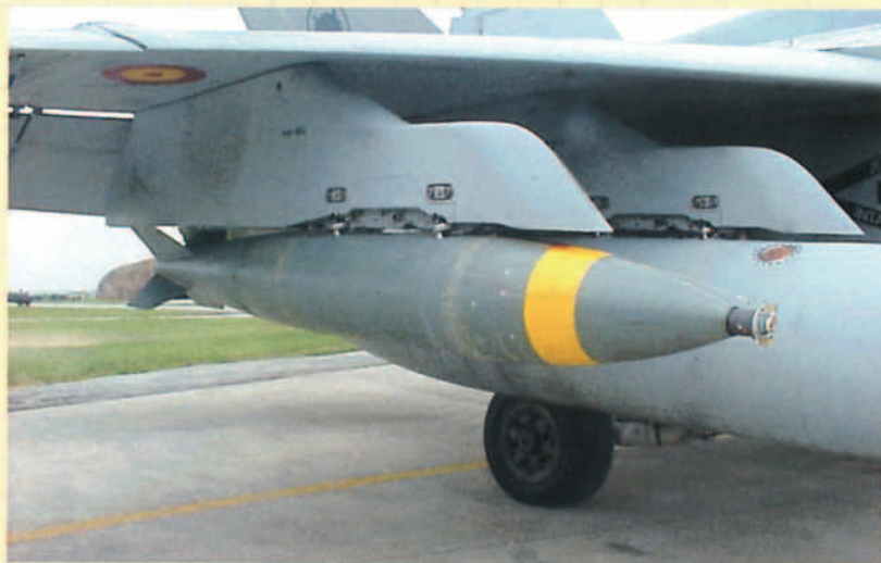
Detalle de una BR-500.