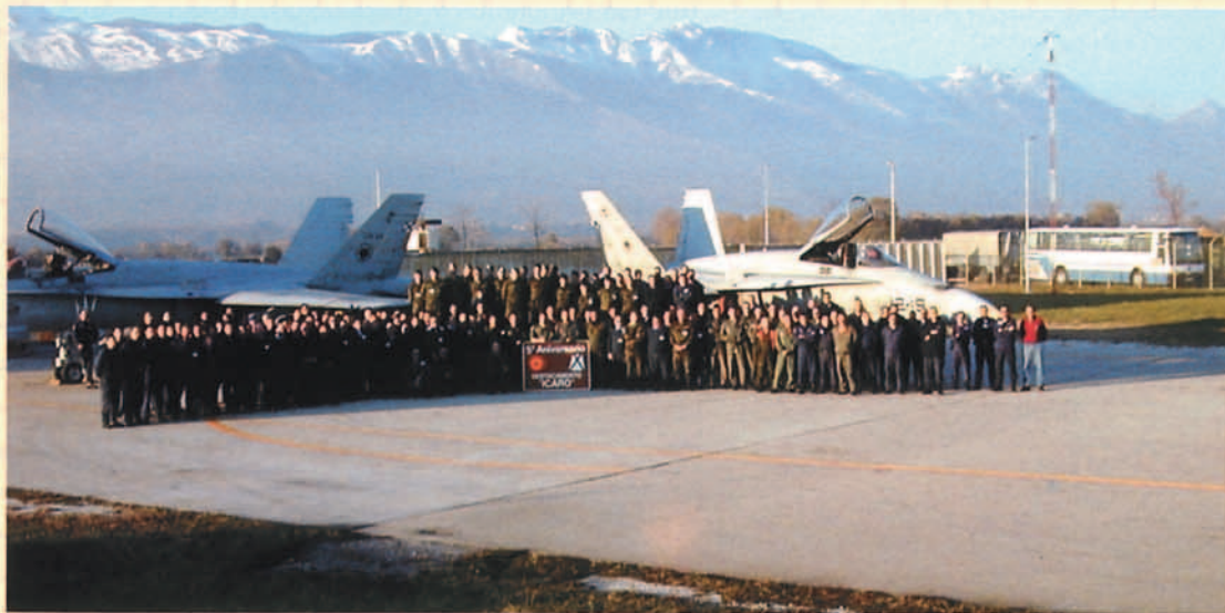
5º aniversario del destacamento Icaro en noviembre de 1999.

En enero de 1999, 45 civiles kosovares de etnia albanesa fueron masacrados por las fuerzas serbias en el pueblo de Racak. Milosevic había roto el alto el fuego y rechazaba toda colaboración con el tribunal de crímenes de guerra.