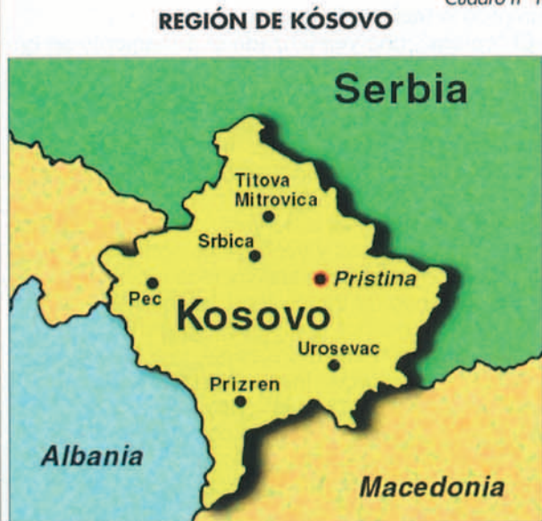
Cuadro n.º 1

Serbios y albaneses se disputan en términos históricos y demográficos esta pequeña región, que constituyó el centro del Imperio Medieval Serbio.