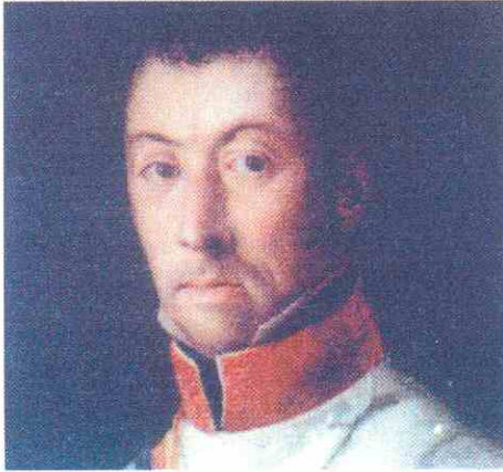
El coronel Francisco Javier de Elío, gobernador de Montevideo en 1808.