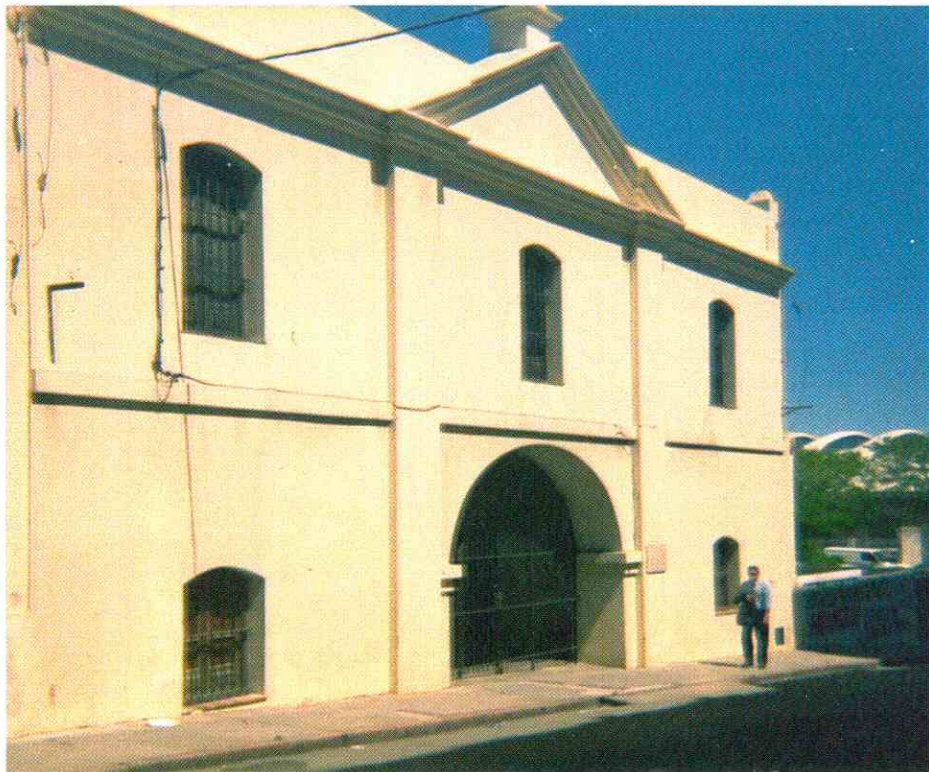
Sede del comando del Apostadero de Montevideo, en el casco antiguo de la ciudad. Desde esta casa se regía el Atlántico Sur para España.

Elío sospechaba del francés Liniers tras la venida al Río de la Plata del enviado de Napoleón, el marqués de Sassenay, y por esto, en un rápido proceso logró soliviantar a la ciudad de Montevideo y ponerla en franca desobediencia