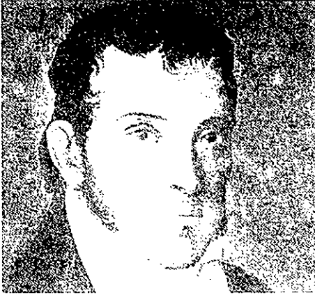
El asesor de Marina en Montevideo Lucas Obes en 1808.

hora se embarcó hasta la Aguada, donde montó a caballo y se puso a salvo» (12).