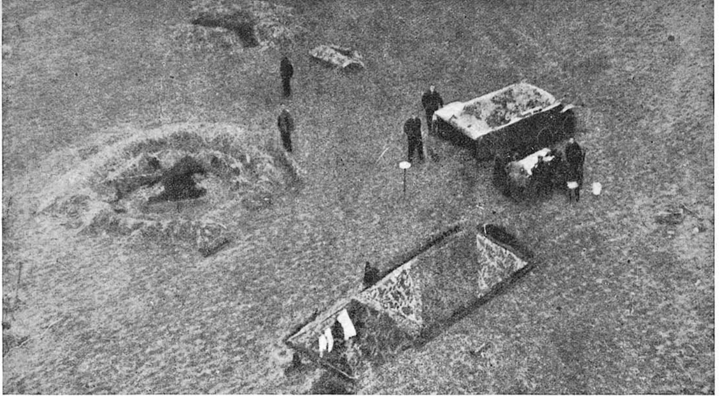
Una posición de artillería ligera A. A. de la Luftwaffe.

Para terminar, y aunque sea en líneas generales, diremos cómo puede ser dentro del Ejército del Aire el Mando del Arma antiaérea.