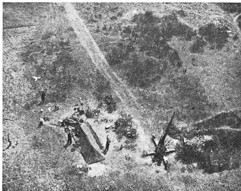
Una posición de artillería pesada A. A. de la Luftwaffe.

Tendrá en su archivo los objetivos nacionales de su Región, clasificados según la importancia y estudiados en estos objetivos los emplazamientos y accesos, así como un plan de defensa aérea, que, en virtud de las circunstancias, someterá a la aprobación del Jefe regional. De este Jefe recibirá la orden de cubrir los objetivos que este Mando designe. Si en el objetivo a defender existe alguna autoridad aérea, de ella dependerá directamente; en caso de que no exista autoridad aérea, pero sí alguna autoridad del Ejército o Marina, será el Jefe de la Región Aérea quien decidirá sobre sus atribuciones para con aquellas otras autoridades militares. De todos modos, estas Unidades de Defensa Activa deben tener la autonomía del empleo de sus fuegos. En Artillería antiaérea no se puede esperar la autorización de nadie para romper el fuego. Ligadas a la Red de Acecho y con instrucciones concretas de sus Jefes, que asumen la responsabilidad total, no pueden existir interferencias.