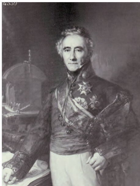
Nº 9.- Retrato de D. Joaquín Navarro del Museo del Ejército, antes de su primer intento de restauración. Obsérvese en el lienzo el número de inventario, que aún conserva el Museo.

A lo anterior se puede añadir que el original de D. Vicente López, del cual copió Sánchez Pescador el del Museo, debió ser pintado por el maestro a partir del Trienio Liberal; deduciendo tal cosa de la casaca sin solapas y con una sola fila de botones que lleva el personaje, y que se corresponde con la norma marcada en 1821 por el Gobierno Constitucional, para los Oficiales del Ejército y que se mantuvo varios años.