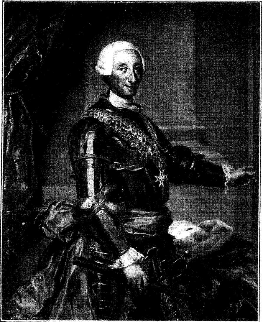
Carlos III el Político