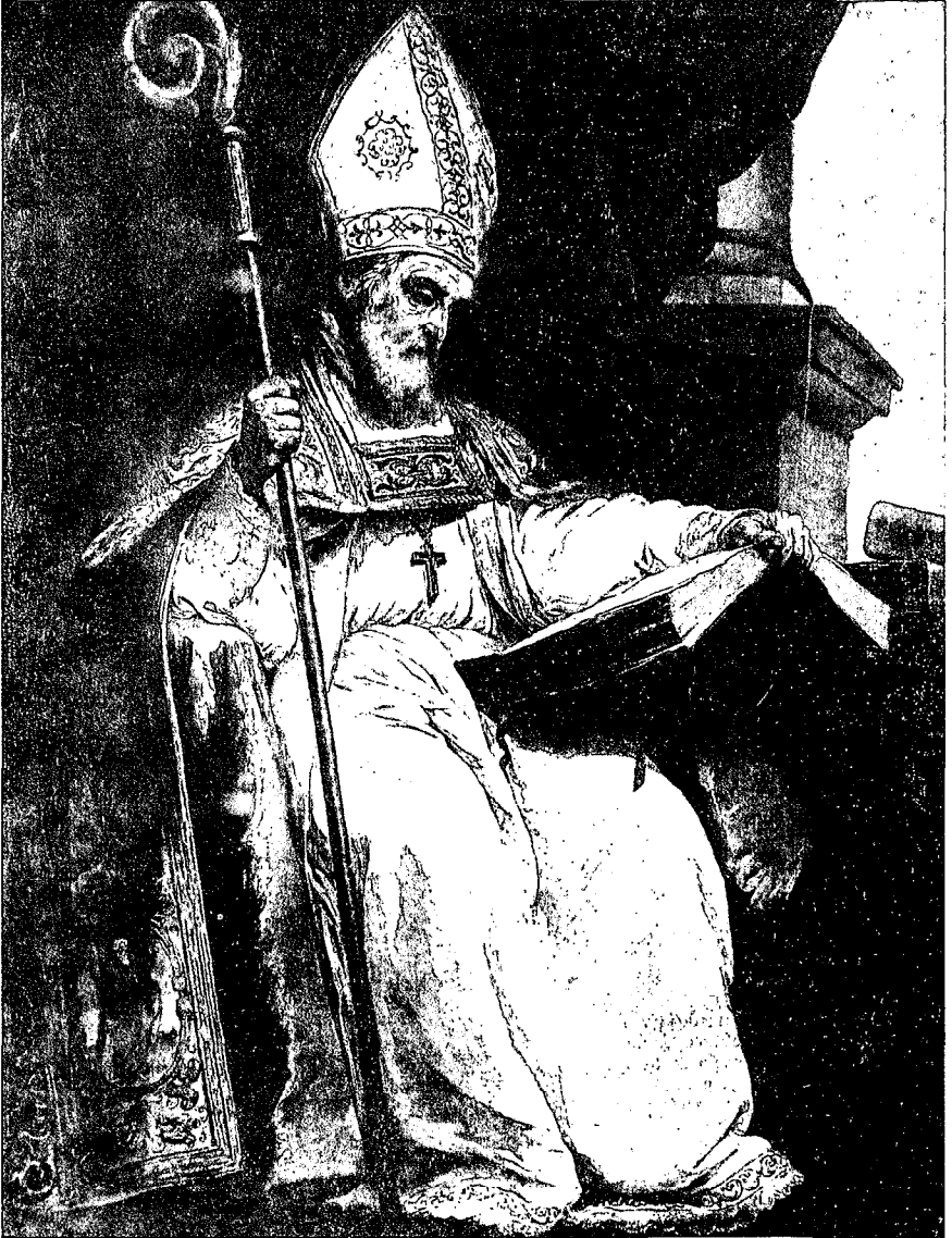
San Isidoro (560-636).