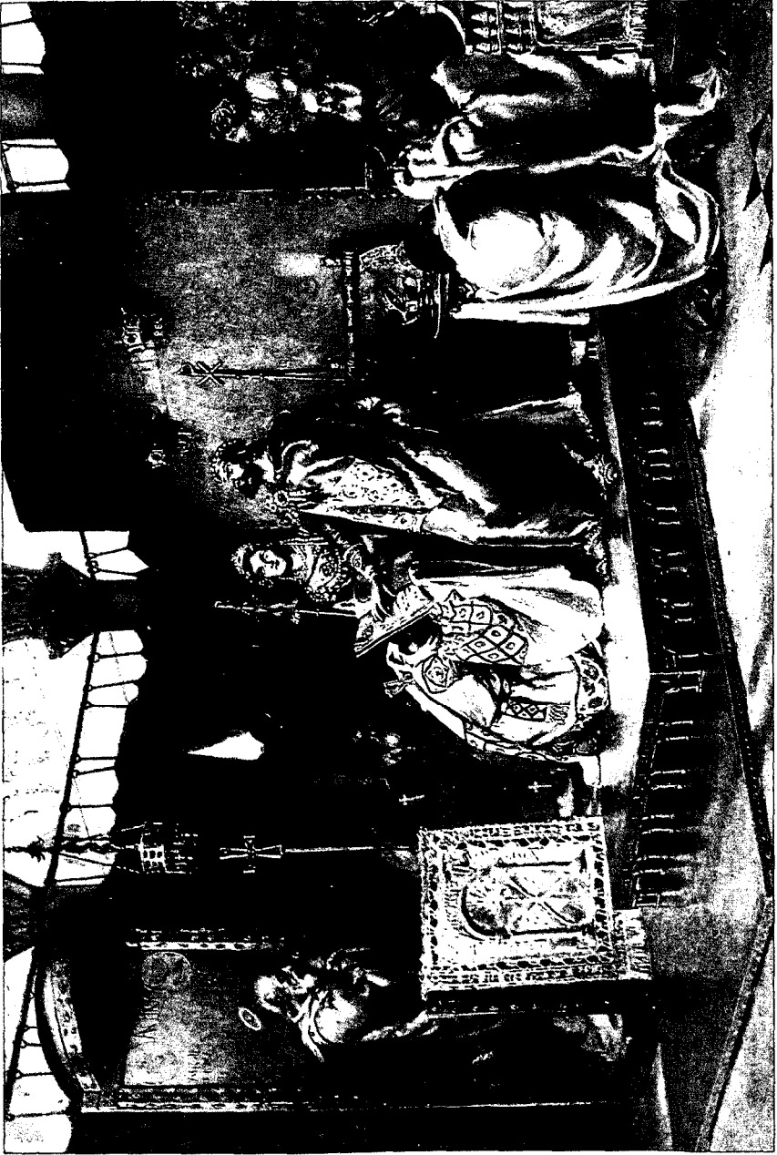
Conversión de Recaredo. Año 587.