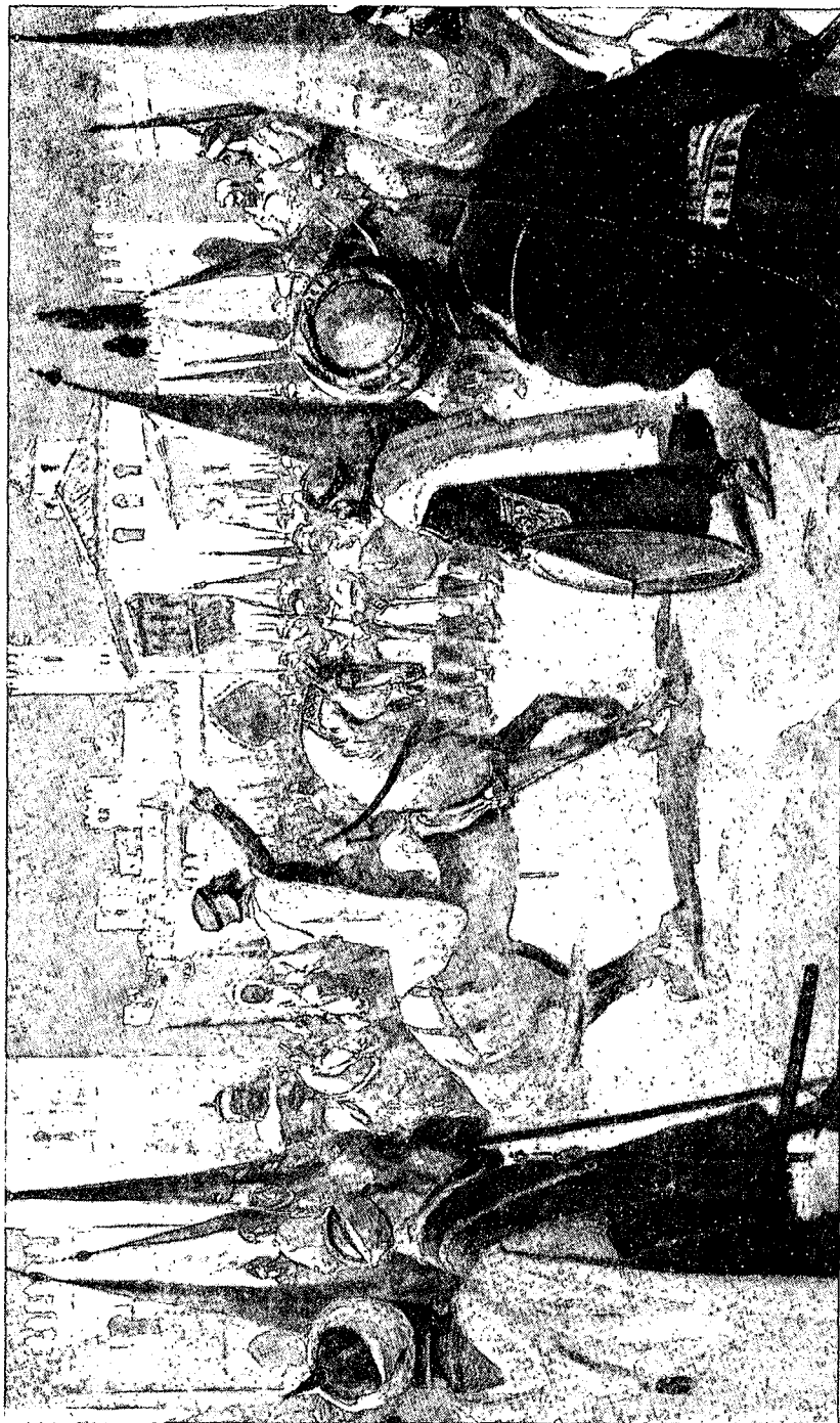
Llamamiento de Abderramán III a los musulmanes (año 913).