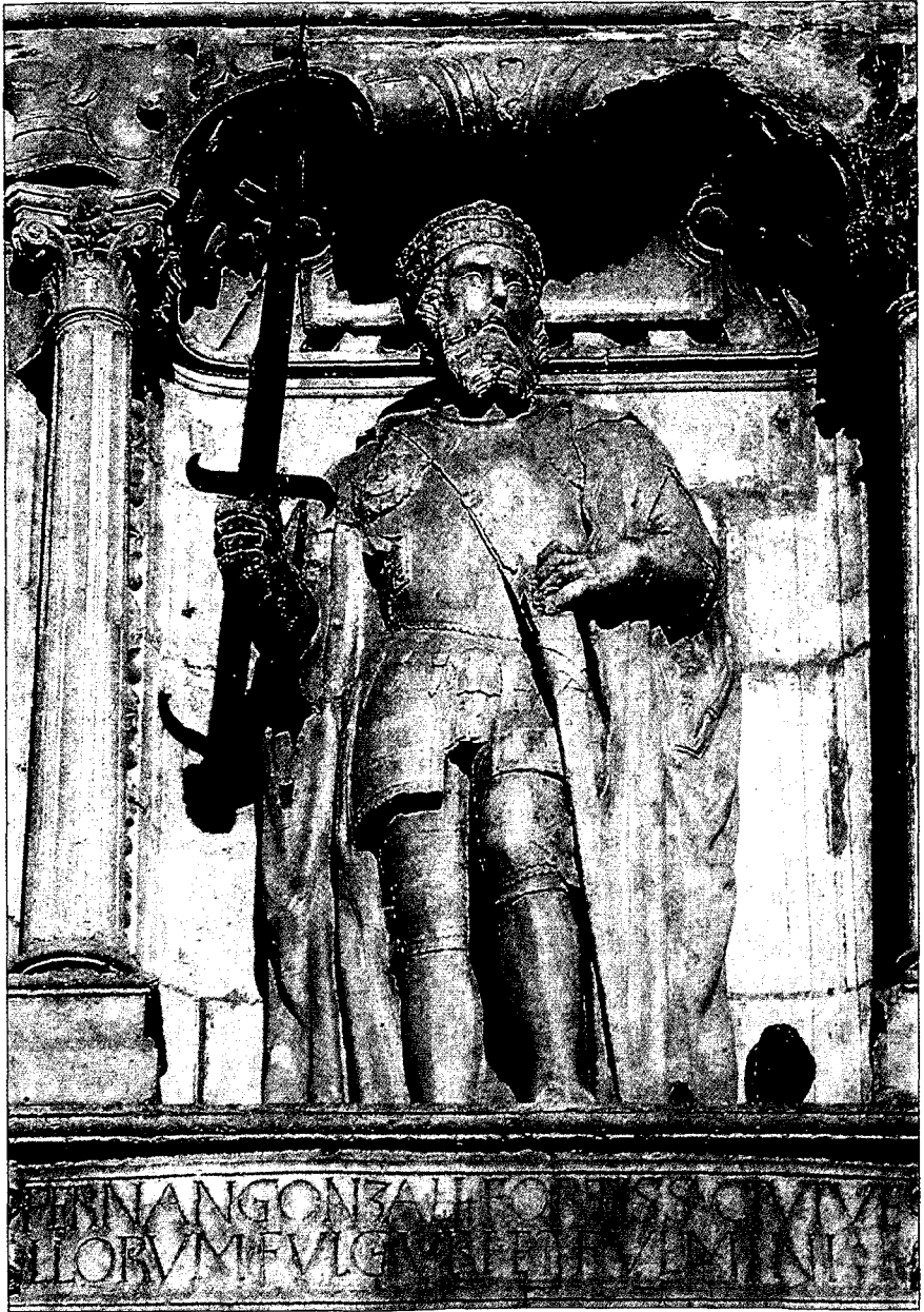
Estatua del conde Fernán González. Siglo XVI. Puerta de Santa María. Burgos.