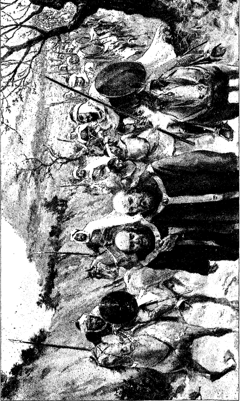
Batalla de Valdejunquera (año 921).