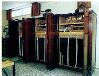
Planchas de cobre para impresión de cartas náuticas